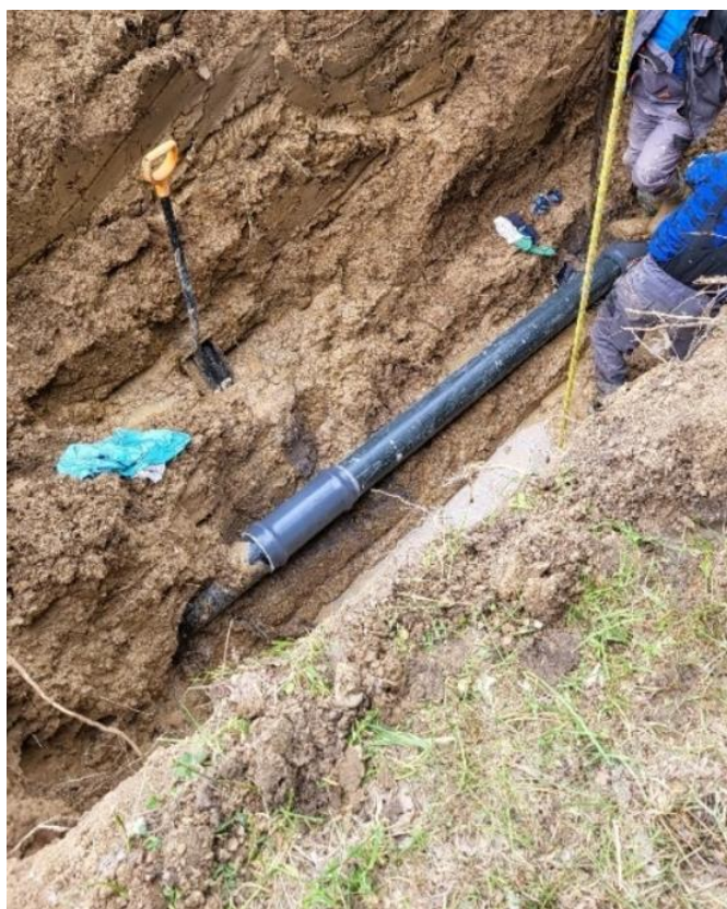
Zdjęcie nr 22 –Awaria na sieci wodociągowej w miejscowości Ciernie, gmina Elk.