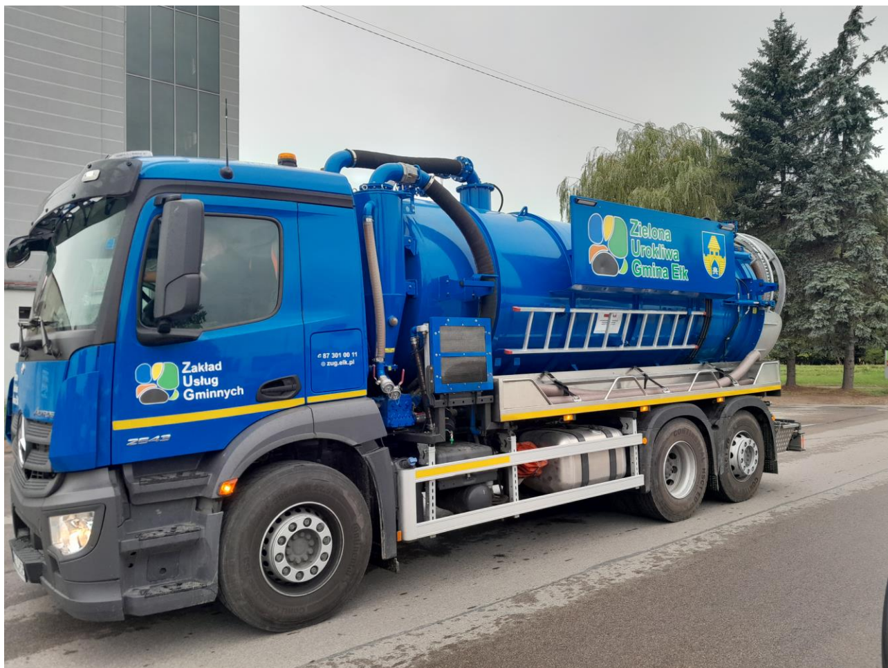
Zdjęcie nr 43 – Wóz asenizacyjny.

Wóz asenizacyjny marki Mercedes to kolejny nowy sprzęt, który powiększył flotę Zakładu Usług Gminnych Gmina Ełk Sp. z o.o. Jest to specjalistyczny pojazd, który służy do odbioru nieczystości płynnych ze zbiorników bezodpływowych oraz osadu z przydomowych oczyszczalni ścieków. Wóz asenizacyjny ma służyć wszystkim mieszkańcom, którzy nie są podłączeni do gminnej kanalizacji sanitarnej.