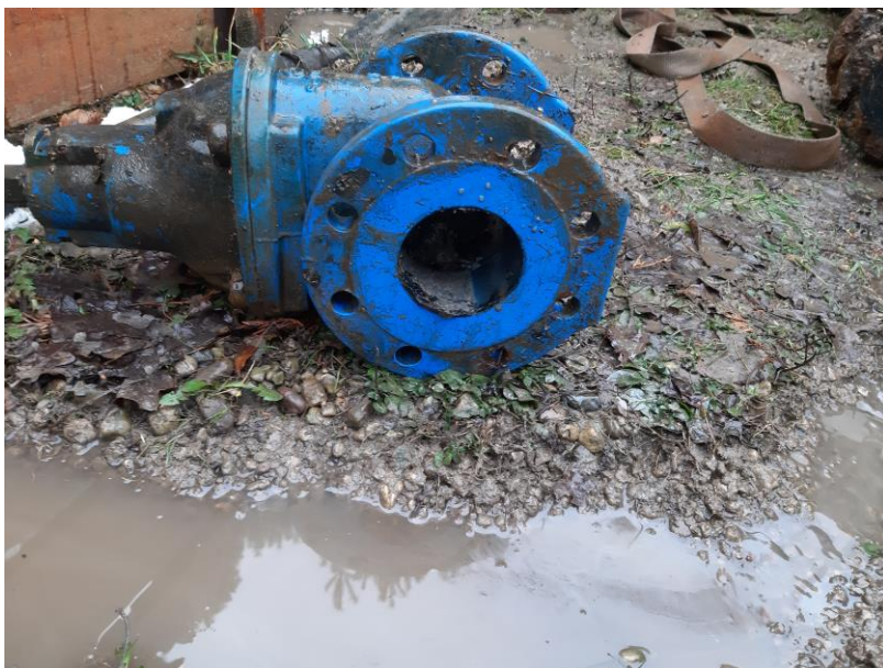
Zdjęcie nr 18 – Modernizacja przepompowni ścieków w miejscowości Oracze, gmina Ełk.

W ramach modernizacji przepompowni ścieków wymieniono układ technologiczny przepompowni ścieków w celu usprawnienia pracy przepompowni ścieków.