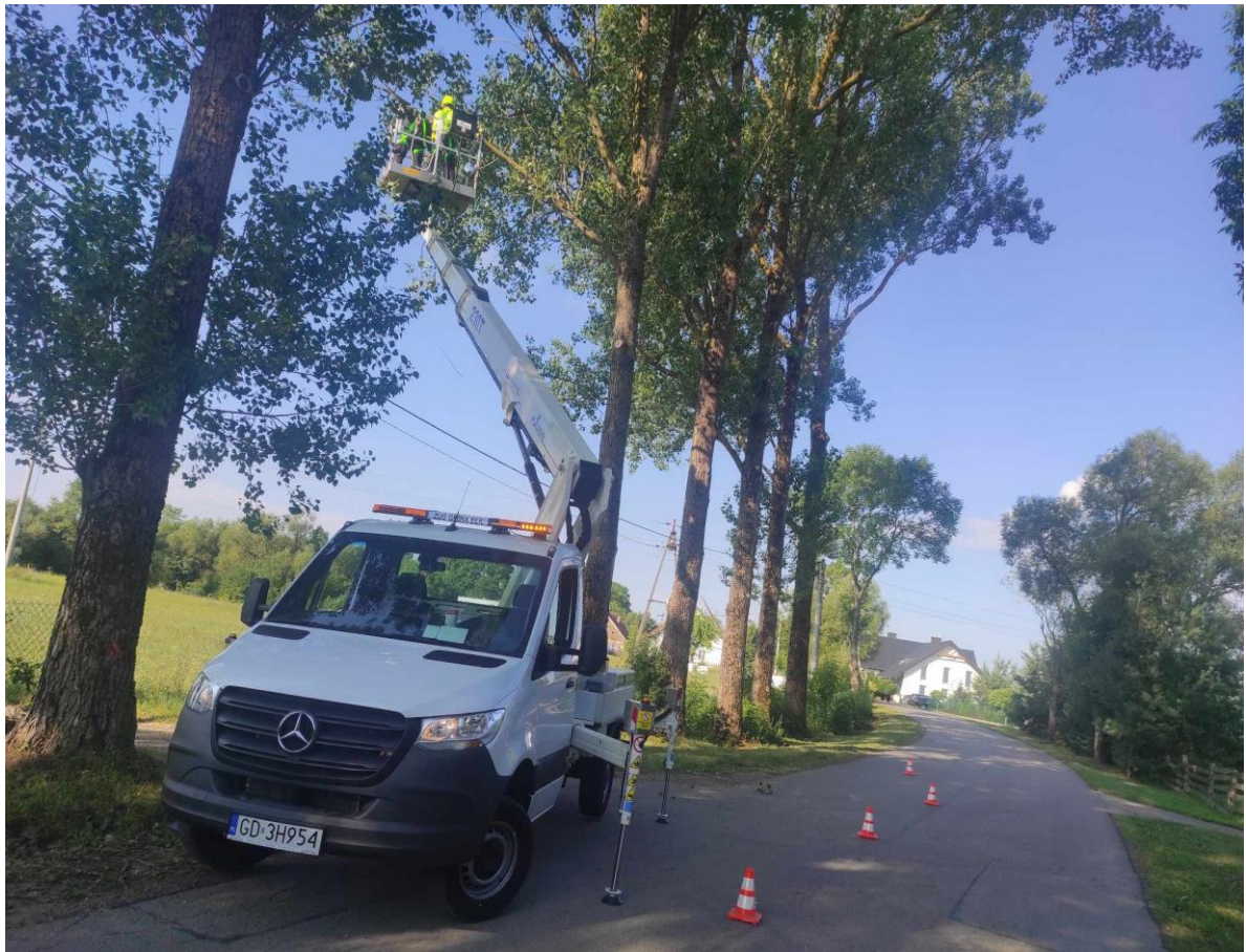
Zdjęcie nr 28 – Prycinanie konarów drzew na terenie gminy Ełk.