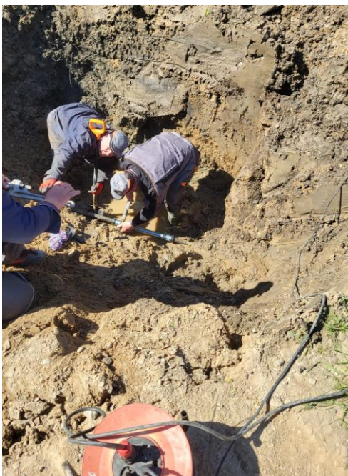
Zdjęcie nr 23 –Awaria na sieci wodociągowej w miejscowości Wityny, gmina Elk.

Oprócz zleceń od prywatnych Inwestorów na budowę sieci wodno-kanalizacyjnych, Zakład Usług Gminnych Gmina Elk Sp. o.o. realizował także pojedyncze zlecenia na budowę przyłączy wodno-kanalizacyjnych na terenie gminy Elk.