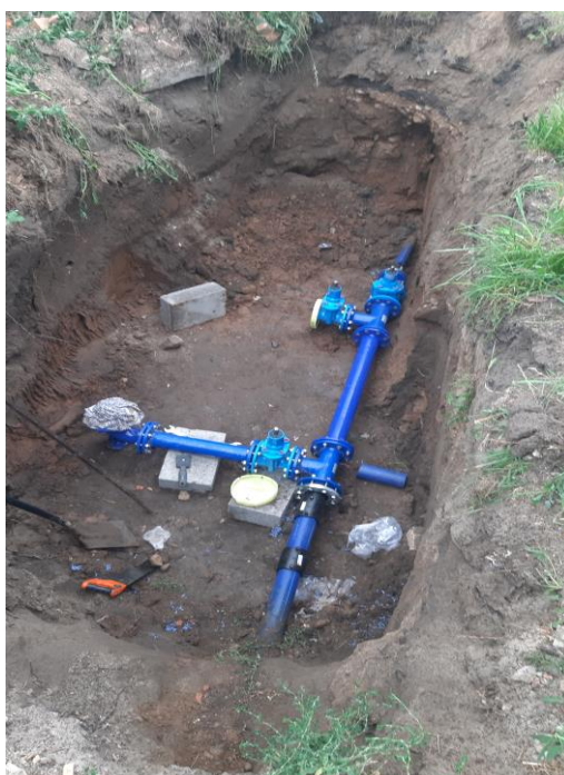
Zdjęcie nr 5 – Budowa sieci wodociągowej na dz. nr geod. 592/1, obręb Oracze, gmina Elk.

W I połowie 2023 r. przystąpiono do realizacji inwestycji budowy sieci wodociągowej na dz. nr geod. 592/1 obręb Oracze w miejscowości Wityny, gmina Elk. W ramach zadania planowane jest wybudowanie około 320 m sieci wodociągowej i 2 hydrantów przeciwpożarowych. Zakończenie inwestycji planowane jest na wrzesień 2023 roku.