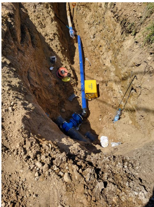
Zdjęcie nr 7 – Budowa sieci wodociągowej na dz. nr geod. 112 ,obręb Lepaki, gmina Elk.

W I połowie 2023 r. przystąpiono do realizacji inwestycji przebudowy sieci wodociągowej na dz. nr geod. 112, obręb Lepaki, gmina Elk. W ramach inwestycji planowane jest wybudowanie sieci wodociągowej o długości około 240 m.