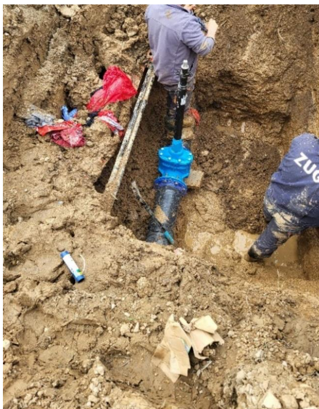
Zdjęcie nr 21 –Awaria na sieci wodociągowej w miejscowości Maleczewo, gmina Elk.