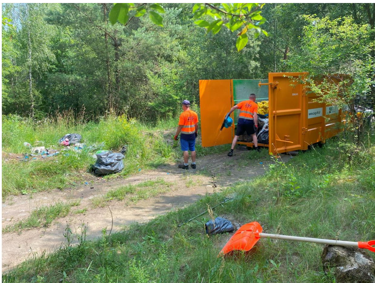
Zdjęcie nr 44 –pracownicy ZUG sprzątają nielegalne wysypisko śmieci.

Niestety, mimo starań i wysiłków ze strony Urzędu Gminy Ełk oraz ZUG w zakresie zarządzania odpadami, stale pojawia się problem wyrzucania śmieci do lasu. Pomimo dostępności opcji nieodpłatnego wywozu odpadów do Przedsiębiorstwa Gospodarki Odpadami „EKO-Mazury” w Siedliskach przez osoby fizyczne, a także możliwości zamawiania regularnego odbioru przez podmioty gospodarcze, wciąż zgłaszane są nielegalne wysypiska śmieci.