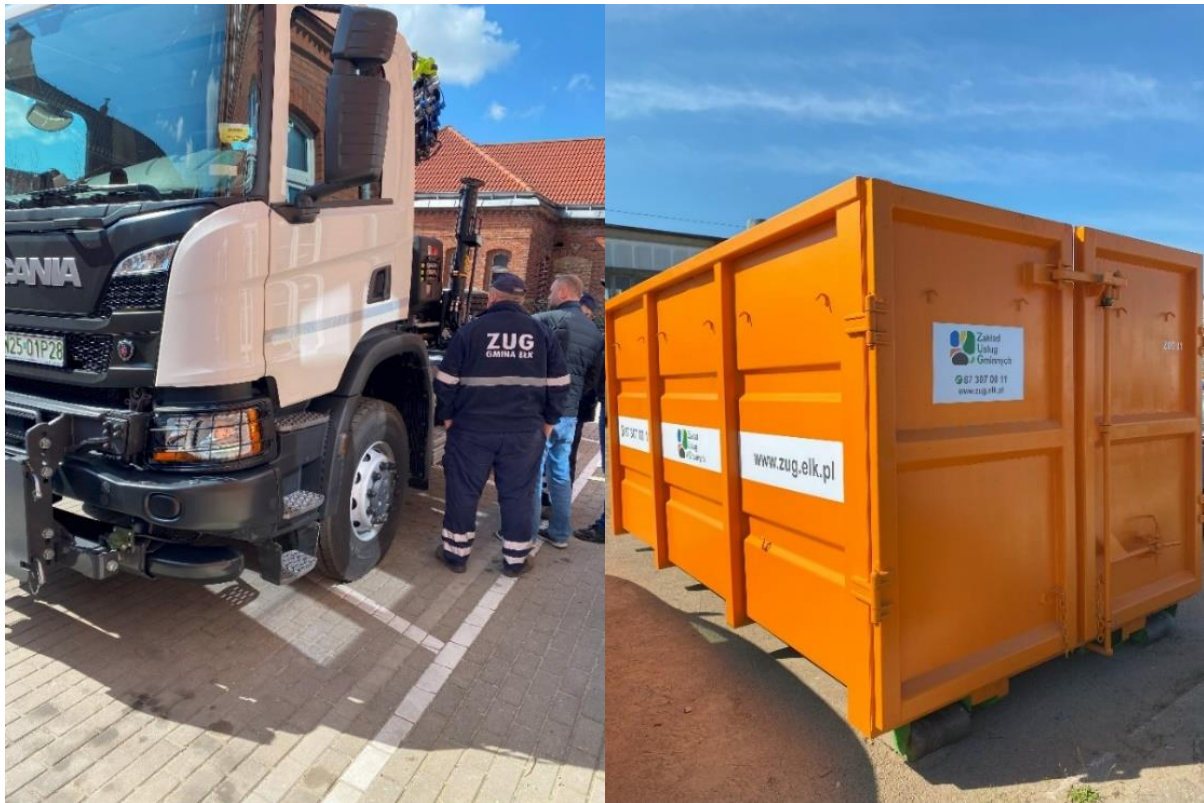
Zdjęcie nr 47 i 48 – kolejno: szkolenie pracowników w zakresie obsługi nowego samochodu ciężarowego typu hakowiec oraz kontener typu KP7.