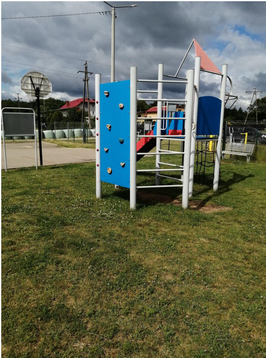
Zdjęcie nr 42 – Plac zabaw w miejscowości Woszczele, gmina Elk.