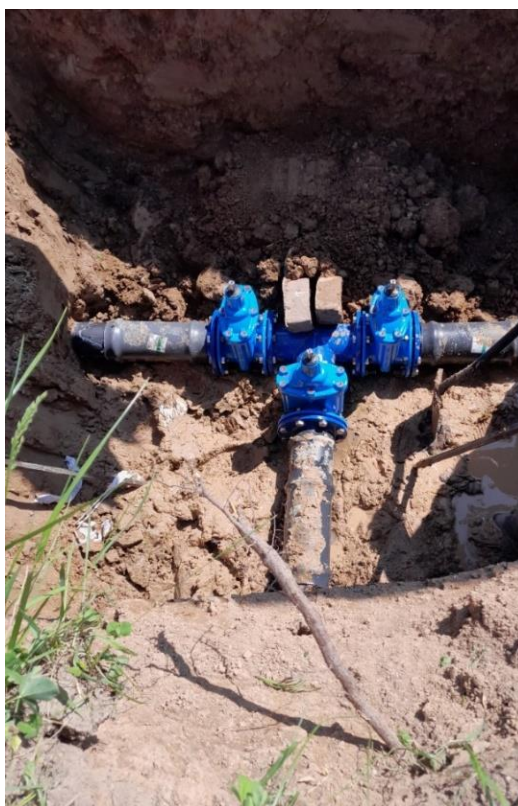
Zdjęcie nr 11 – Wymiana węzła zasuw na kierunku Rostki Bajtkowskie- Karbowskie, gmina Elk.