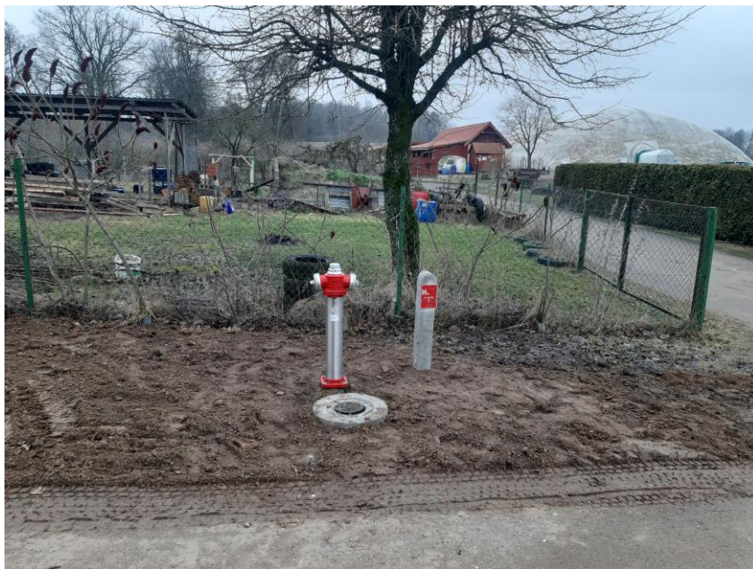
Zdjęcie nr 10 – Wymiana hydrantu ppoż. w miejscowości Janisze, gmina Elk.