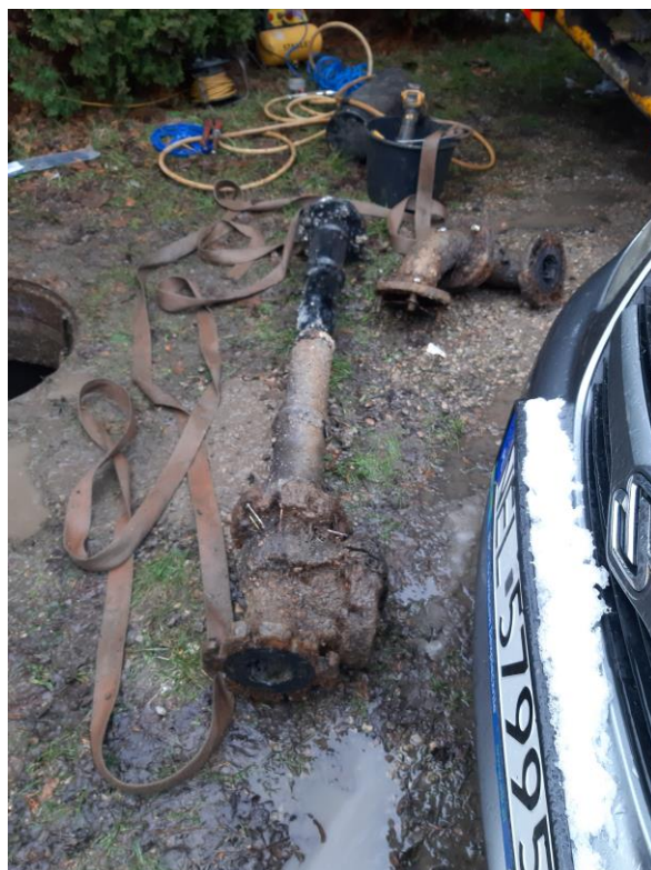
Zdjęcie nr 19 – Modernizacja przepompowni ścieków w miejscowości Oracze, gmina Ełk.