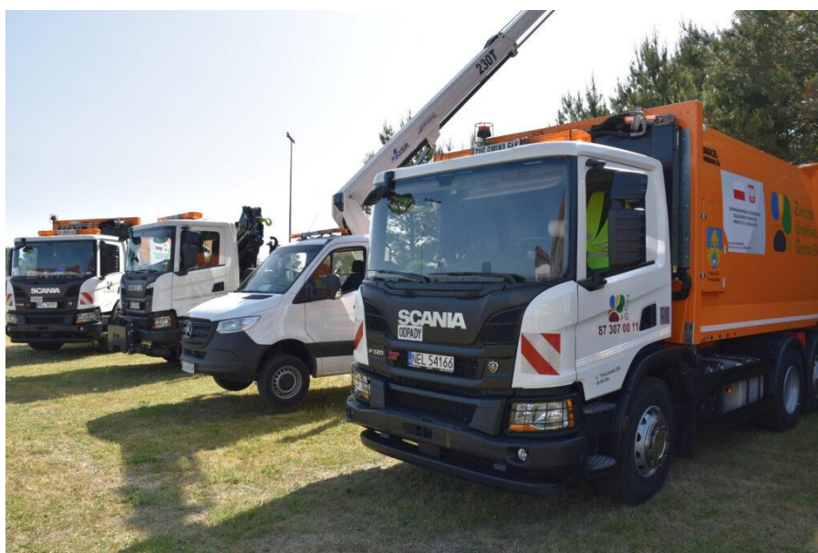
Zdjęcie nr 51 – Samochody przeznaczone do odbioru odpadów na stanowisku ZUG podczas gminnych obchodów Dnia Dziecka.

Uczniowie byli bardzo zaangażowani i zainteresowani przebiegiem festynu, chętnie brali udział w zabawach. Wszystko to razem stworzyło wspaniałą atmosferę sprzyjającą integracji społeczności i edukacji w duchu ekologicznym.