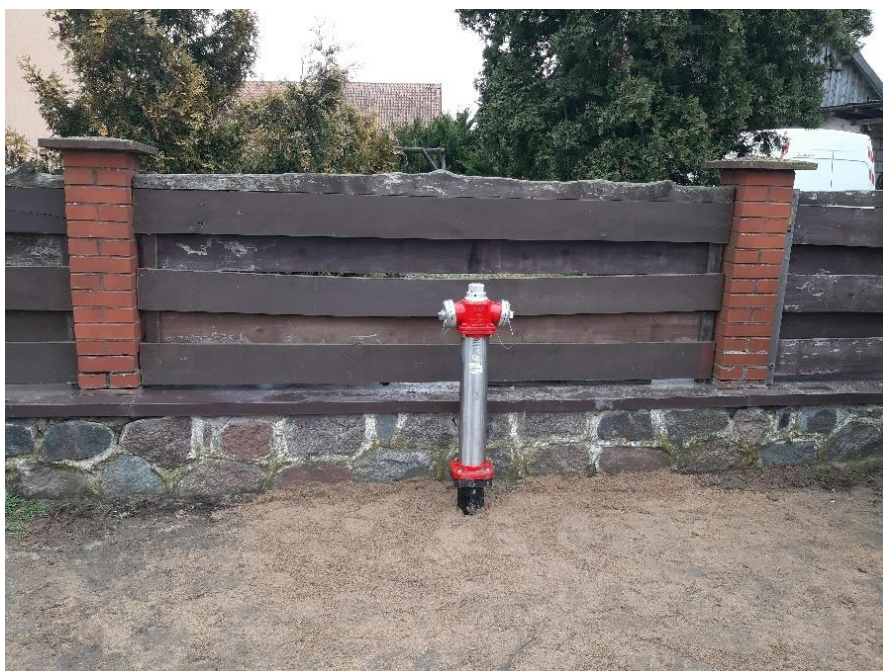
Zdjęcie nr 9 – Wymiana hydrantu ppoż. w miejscowości Suczki, gmina Ełk.