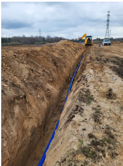
Zdjęcie nr 16 –Nadzór nad budową sieci wodociągowej na dz. nr geod. 38/76 obręb Maleczewo,, gmina Elk.

Inwestor w porozumieniu z Zakładem Usług Gminnych Gmina Elk Sp. z o.o. wybudował sieć wodociągową w miejscowości Maleczewo o długości około 1,5 km. Wmontowano także 10 sztuk hydrantów. Sieć wodociągowa zostanie przekazana na stan Zakładu Usług Gminnych Gminy Elk Sp. z o.o.