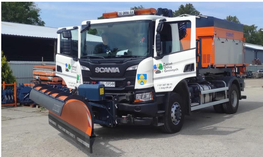
Zdjęcie nr 33 – Samochód ciężarowy typu hakowiec.

W związku z rozwojem Spółki i coraz większymi nakładami pracy, flota samochodowa została powiększona o samochód typu hakowiec, który będzie wykorzystywany do realizacji umowy na bieżące utrzymanie dróg, a zimą przy realizacji umowy na zimowe utrzymanie dróg poprzez wyposażenie w pług odśnieżny i posypywarę.