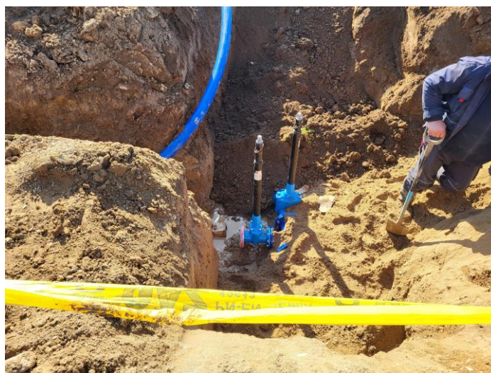
Zdjęcie nr 17 –Nadzór nad budową sieci wodociągowej na dz. nr geod. 38/76 obręb Maleczewo,, gmina Elk.