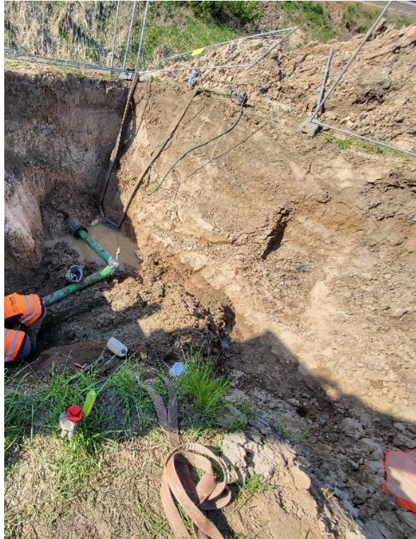
Zdjęcie nr 14 –Nadzór nad przebudową kanalizacji ciśnieniowej w miejscowości Siedliska, gmina Ełk.