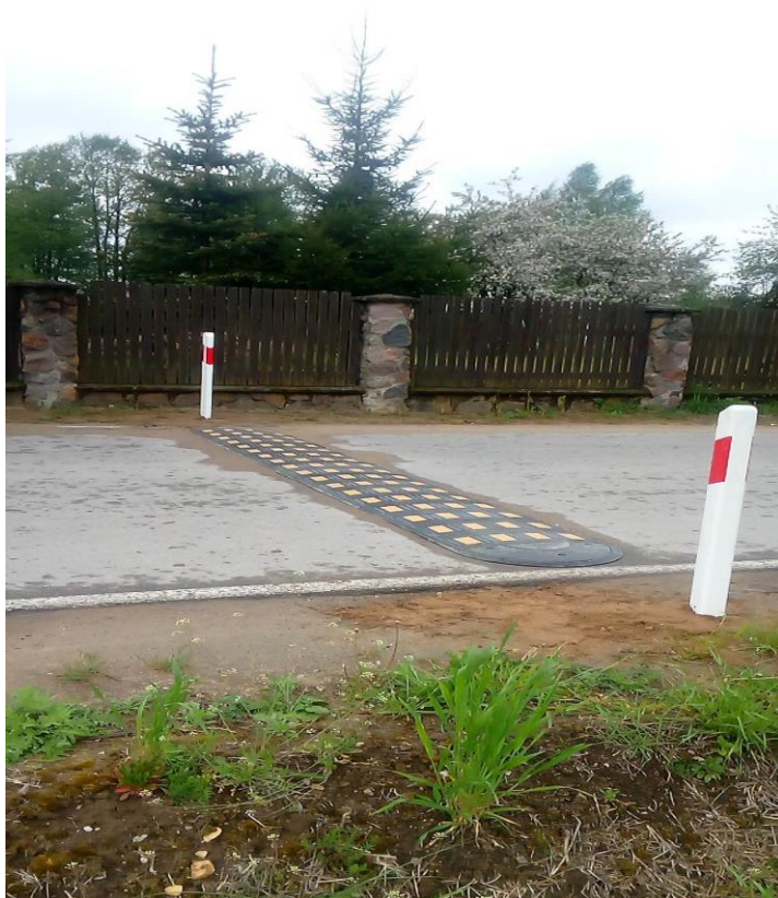
Zdjęcie nr 29 – Prace związane z utrzymaniem infrastruktury na terenie gminy Elk.