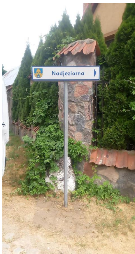
Zdjęcie nr 30 – Prace związane z utrzymaniem infrastruktury na terenie gminy Elk.