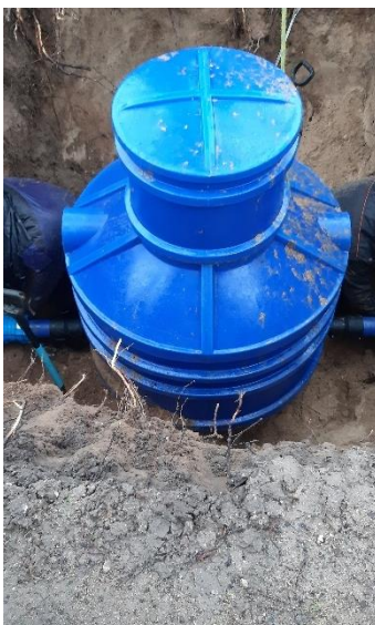
Zdjęcie nr 12 –Montaż studni pomiarowej w miejscowości Straduny, ul. Nadjeziorna, gmina Elk.

Studnię wodomierzową z zestawem wodomierzowym zamontowano w celu pomiaru zużycia wody na ogródkach działkowych w miejscowości Straduny, gmina Elk.