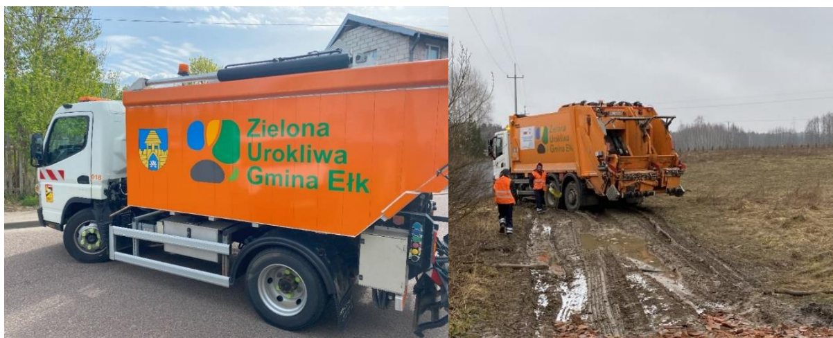
Zdjęcie nr 45 i 46 – kolejno: mała śmieciarka i problemy z dojazdem.

W 2023 roku powiększyła się flota pojazdów odbierających śmieci. Wprowadzenie do działu gospodarki odpadami komunalnymi samochodu ciężarowego dwukomorowego typu śmieciarka o mniejszych gabarytach od dotychczas posiadanych stanowi ważny krok w doskonaleniu procesów związanych z odbiorem odpadów. Znaczącą zaletą mniejszego pojazdu jest zdolność dotarcia w mniej dostępne miejsca, do których wcześniej większy pojazd nie był w stanie dotrzeć. Często tereny wiejskie, czy miejsca o ograniczonej przestrzeni były wyzwaniem dla tradycyjnych śmieciarek, a w szczególności w okresie roztopów i silnych opadów. W takich sytuacjach, prace mogą być opóźnione lub nawet całkowicie zawieszane do momentu, gdy warunki terenowe poprawią się wystarczająco. Nowa śmieciarka o mniejszych gabarytach pozwala na skuteczniejsze obsługiwanie tych obszarów, co przyczynia się do zwiększenia zakresu zasięgu odbioru odpadów i poprawy jakości usług.