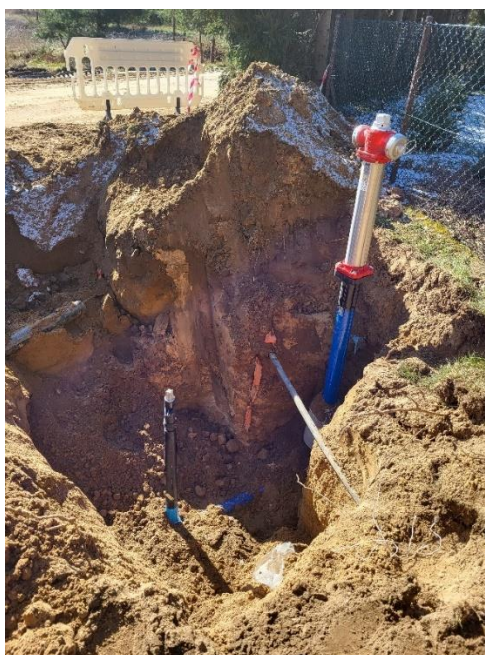
Zdjęcie nr 4 – Inwestycja rozbudowy sieci wodociągowej w miejscowości Mrozy Wielkie, gmina Elk.