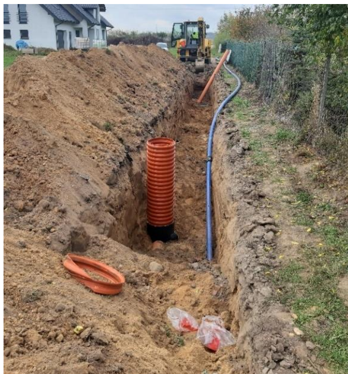
Zdjęcie nr 2 – Inwestycja budowy sieci wod.-kan. w miejscowości Nowa Wieś Elcka, gmina Elk.