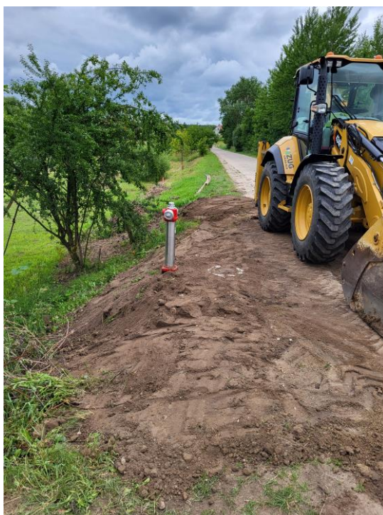
Zdjęcie nr 6 – Budowa sieci wodociągowej na dz. nr geod. 592/1, obręb Oracze, gmina Elk.