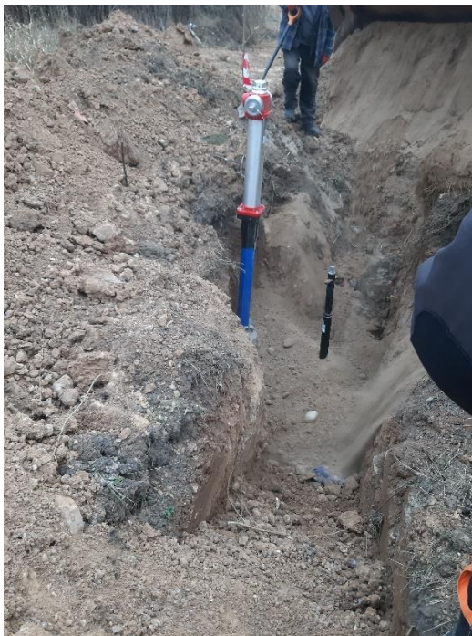
Zdjęcie nr 3 – Inwestycja budowy sieci wodociągowej w obrębie POHZ Ełk, gmina Ełk.

Budowa sieci wodociągowej zrealizowana została wraz z prywatnymi inwestorami na podstawie zawartego porozumienia z Zakładem Usług Gminnych Gmina Ełk Sp. z o.o. na przekazanie sieci wodociągowej. W ramach inwestycji wybudowano około 330 m sieci wodociągowej. Zamontowano także trzy hydranty przeciwpożarowe. Wybudowana sieć wodociągowa zostanie przekazana na stan Zakładu Usług Gminnych Gminy Ełk Sp. z o.o.