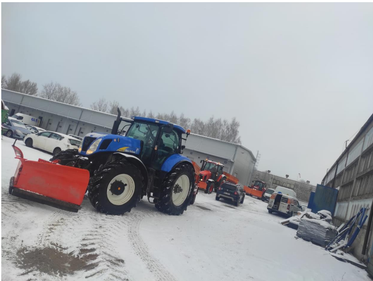
Zdjęcie nr 24 – Ciągnik NEW HOLLAND przygotowany do zimowego utrzymania dróg na terenie gminy Ełk.

Zimowe utrzymanie dróg obejmuje prace mające na celu zmniejszenie lub ograniczenie zakłóceń ruchu drogowego wywołanych takimi czynnikami atmosferycznymi jak śliskość zimowa oraz opady śniegu. Spółka dysponuje specjalistycznym sprzętem do posypywania i odśnieżania dróg tj. ciągniki z posypywarką i pługiem odśnieżnym, samochodem ciężarowym z posypywarką i pługiem odśnieżnym. W I połowie 2023 r. został zakupiony ciągnik marki New Holland oraz 30.06.2023r. zakupiono nowy sprzęt do zimowego utrzymywania dróg – posypywarkę i pług odśnieżny marki OZAMET.