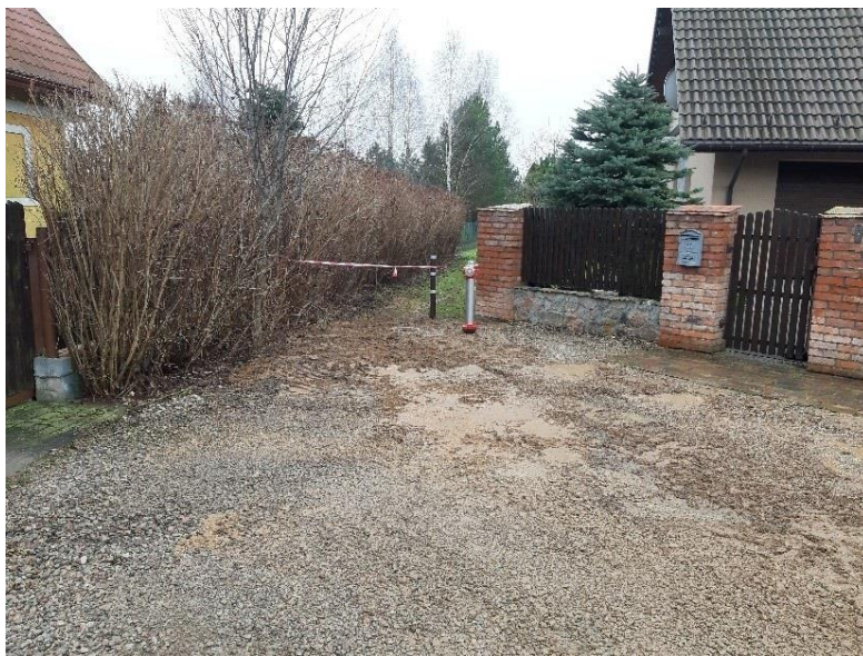
Zdjęcie nr 8 – Wymiana hydrantu ppoż. w miejscowości Straduny, gmina Ełk.