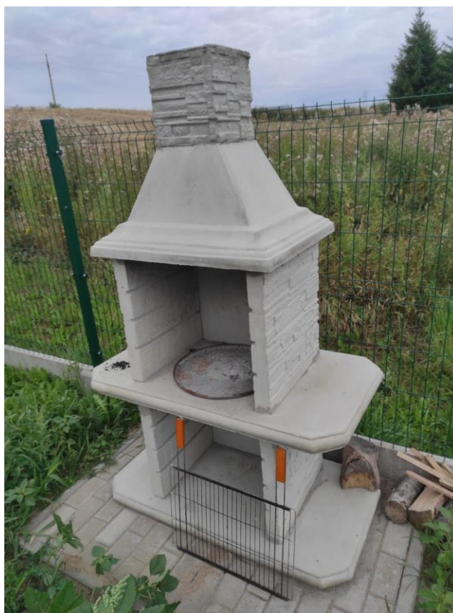
Zdjęcie nr 39 – Zagospodarowanie wiaty wraz z przyległym terenem w sołectwie Szosa Bajtkowska gmina Elk.