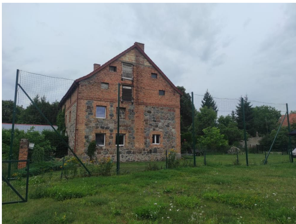
Zdjęcie nr 36 – Piłkochwyty w miejscowości Pistki gmina Elk.