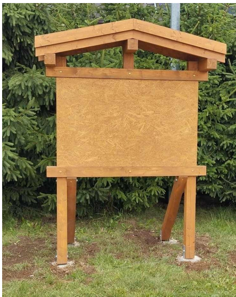
Zdjęcie nr 37 – Tablica informacyjna w Talusach, gmina Elk.