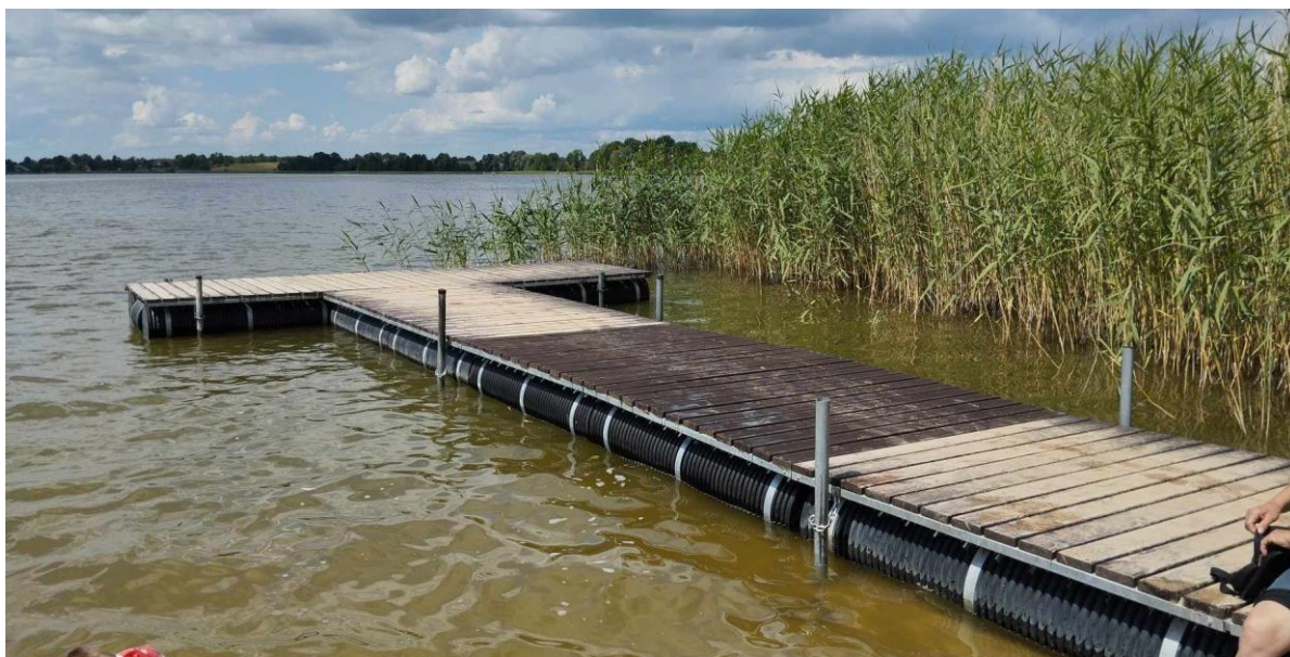
Zdjęcie nr 34 – Pomost pływający w miejscowości Bajtkowo, gmina Elk.

Fundusz sołecki to środki finansowe wyodrębnione w budżecie Gminy Elk, które są zagwarantowane dla sołectw na wykonanie przedsięwzięć służących poprawie warunków życia. To zebranie wiejskie – czyli mieszkańcy danego sołectwa podejmują decyzje na co mają zostać wykorzystane środki finansowe. Dlatego też, to samym mieszkańcom zależy na tym, aby środki były wydawane w sposób prawidłowy i efektywny. W ramach zadań z Funduszu Sołeckiego Spółka wykonała w I połowie 2023 roku takie zadania jak: