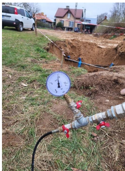
Zdjęcie nr 15 –Nadzór nad przebudową sieci wodociągowej w miejscowości Straduny, gmina Ełk.