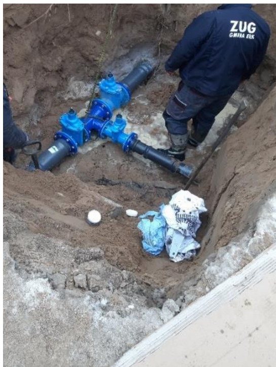
Zdjęcie nr 13 –Montaż węzła zasuw w miejscowości Malinówka, gmina Elk.