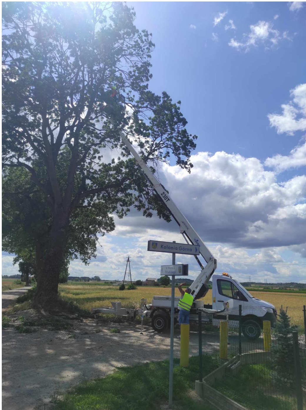
Zdjęcie nr 27 – Przcycinanie konarów drzew na terenie gminy Elk.

Spółka w 2023 r. podpisała umowę o leasing operacyjny na nowy podnośnik koszowy tzw. zwyżkę o wysokości podnośnika 23 m i udźwigu 230 kg, podnośnik umiejscowiony jest na samochodzie marki Mercedes. Tego typu sprzęt jest niezbędny przy pracach związanych z bieżącym utrzymaniem zieleni, ale również m.in. przy utrzymaniu czystości lamp ulicznych, pracach konserwatorskich na budynkach.