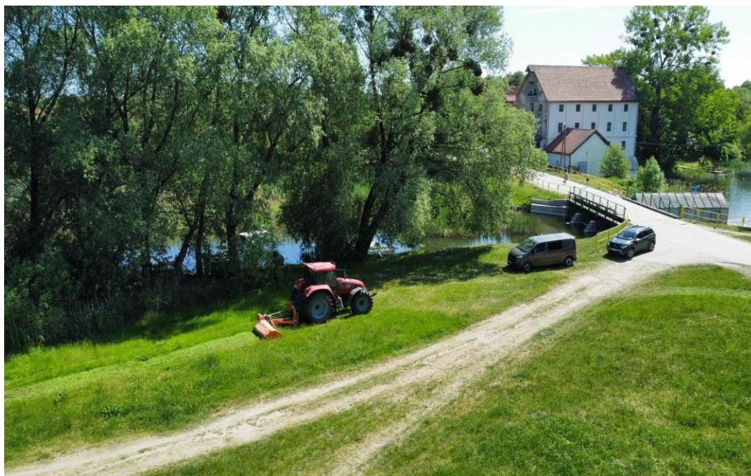
Zdjęcie nr – 25 Prace związane z utrzymaniem zieleni na terenie gminy Elk.