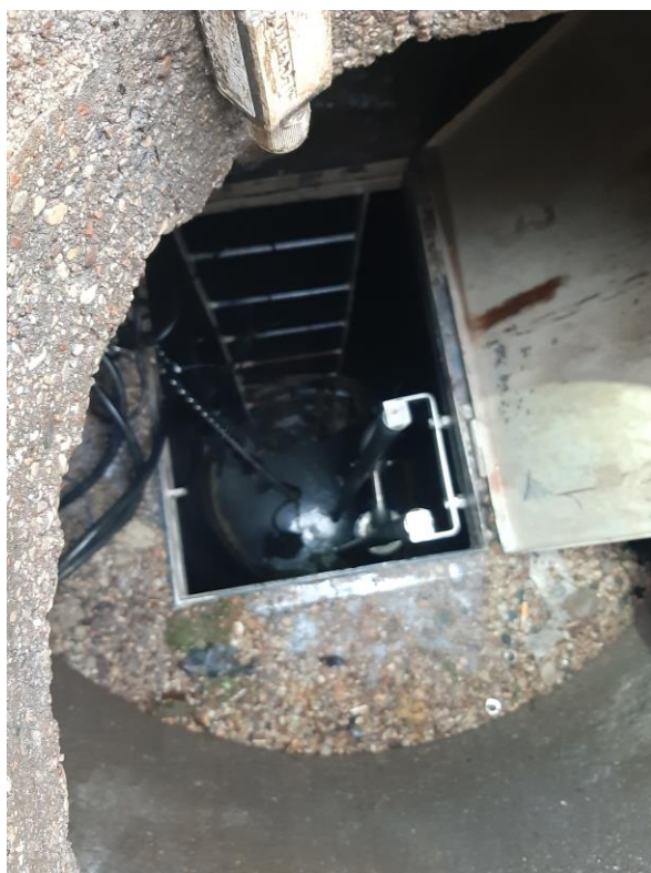
Zdjęcie nr 20 – Modernizacja przepompowni ścieków w miejscowości Oracze, gmina Elk.