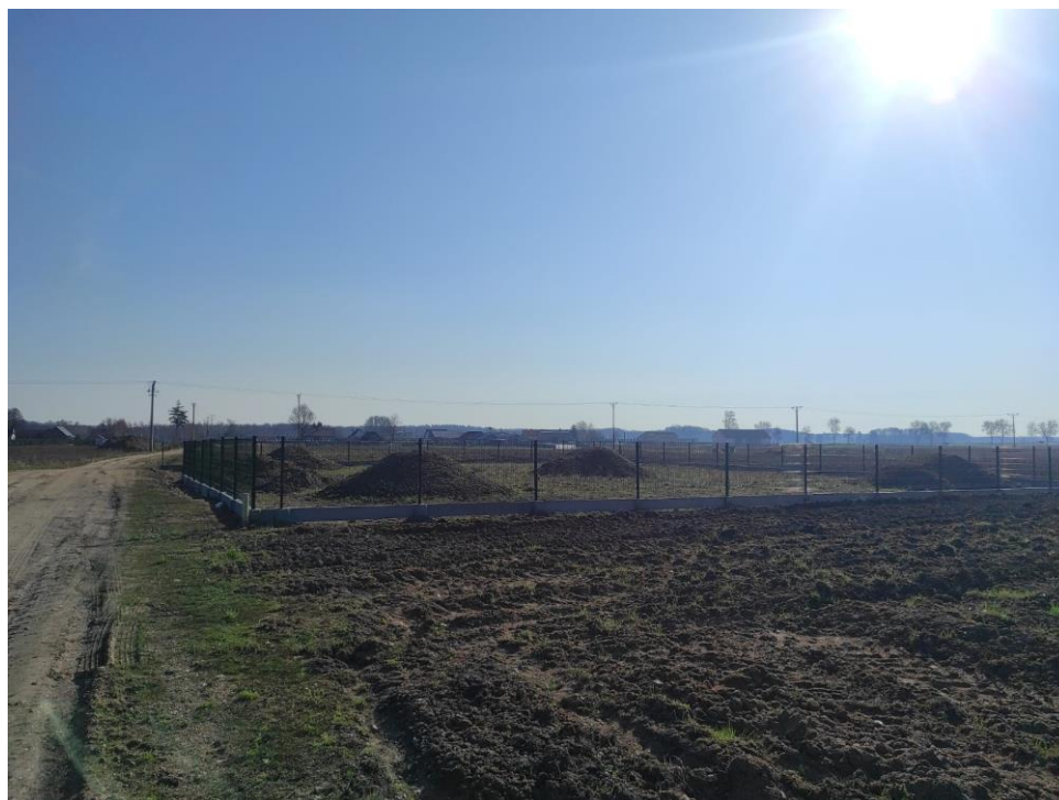
Zdjęcie nr 35 – Ogrózenie panelowe w miejscowości Zdunki, gmina Elk.