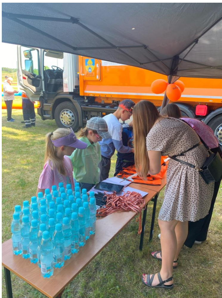
Zdjęcie nr 49 – dzieci rozwiązujące quiz przygotowany przez pracowników ZUG.

Podczas imprezy nie brakowało ekologicznych gier i zabaw. Dużą popularnością wśród dzieci i młodzieży cieszył się quiz dotyczący poprawnej segregacji, zorganizowany przez naszą Spółkę. Na tabletach pojawiało się ok. 20 ponumerowanych kart, po naciśnięciu dowolnej karty pojawiał się losowy odpad, który następnie należało dopasować do odpowiedniego pojemnika. Po dopasowaniu poprawnie 3 odpadów, konkursowicz mógł wybrać jeden z przygotowanych gadżetów: smycz, notes, ołówek, długopis, worek, naklejki z tabliczką mnożenia. Ponadto uczestnicy mogli brać udział w konkurencjach sportowych, podziwiać pokazy artystyczne, wziąć udział w konkursie ciast oraz wymienić książki i rośliny. Nie zabrakło również prezentacji pojazdów służących do odbierania odpadów oraz występów służb mundurowych.