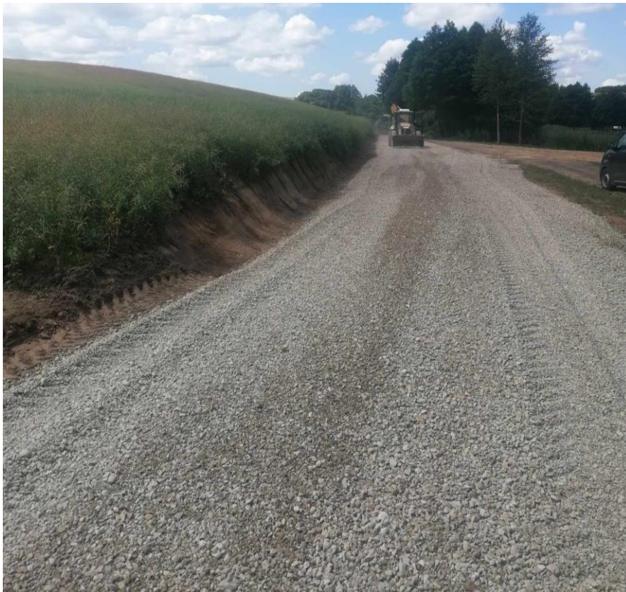
Zdjęcie nr 32 – Wykonanie drogi w miejscowości Mącze, gmina Elk.

W związku z rozwojem Spółki i coraz większymi nakładami pracy, flota samochodowa została powiększona o samochód typu hakowiec, który będzie wykorzystywany do realizacji umowy na bieżące utrzymanie dróg, a zimą przy realizacji umowy na zimowe utrzymanie dróg poprzez wyposażenie w pług odśnieżny i posypywarę.