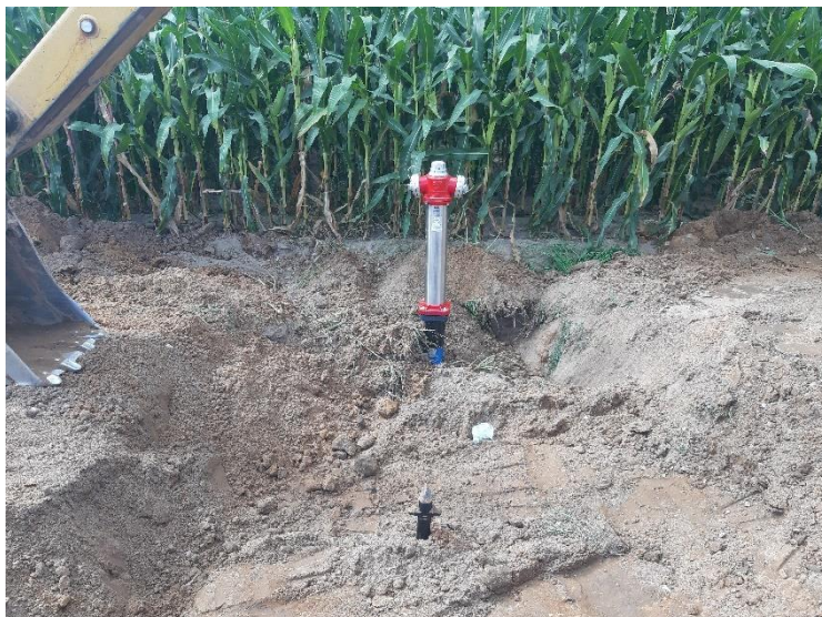
Zdjęcie nr 1 – Inwestycja budowy sieci wod.-kan. w miejscowości Nowa Wieś Elcka, gmina Elk.

W ramach inwestycji wybudowano około 750 m sieci wodociągowej i około 270 m sieci kanalizacji sanitarnej. Zamontowano także 5 sztuk hydrantów przeciwpożarowych.