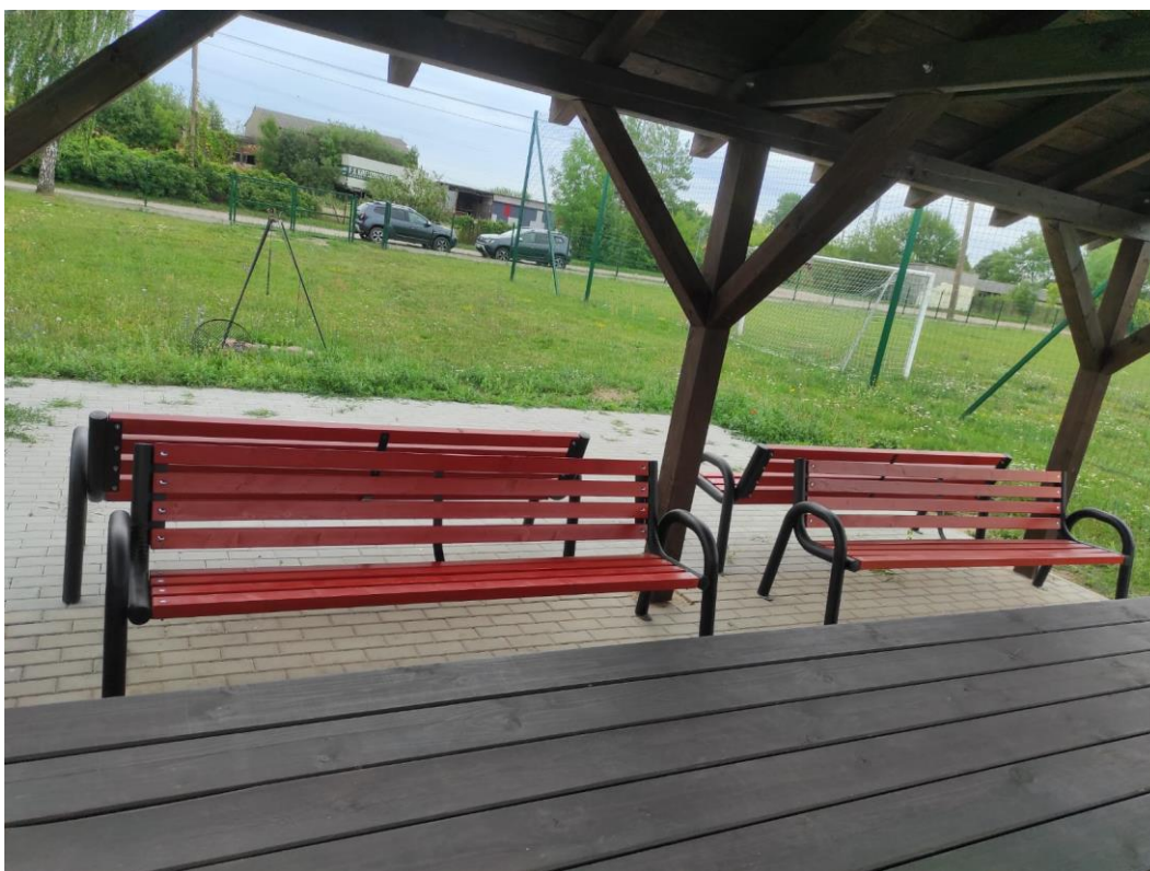
Zdjęcie nr 38 – Zagospodarowanie wiaty wraz z przyległym terenem w sołectwie Szosa Bajtkowska, gmina Elk.