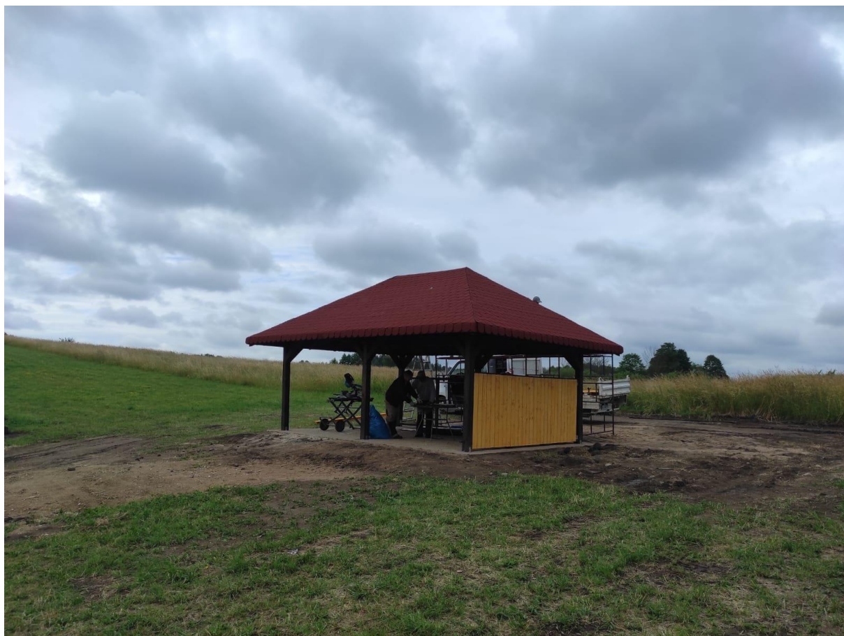
Zdjęcie nr 40 – Wiata rekreacyjna w miejscowości Przytuły, gmina Ełk.

Zakład Usług Gminnych Gmina Ełk Sp. z o.o. w maju br. podpisał umowę na wykonanie robót budowlanych polegających na budowie wiaty rekreacyjnej w miejscowości Przytuły. To kolejna taka inwestycja służąca mieszkańcom w celach rekreacyjnych, która została finansowana dzięki współpracy Starostwa Powiatowego oraz Centrum Kultury Gminy Ełk i Urzędu Gminy Ełk.