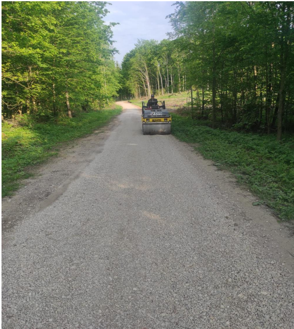
Zdjęcie nr 41 – Remont drogi w m. Siedliska ul. Mleczna, gmina Elk.