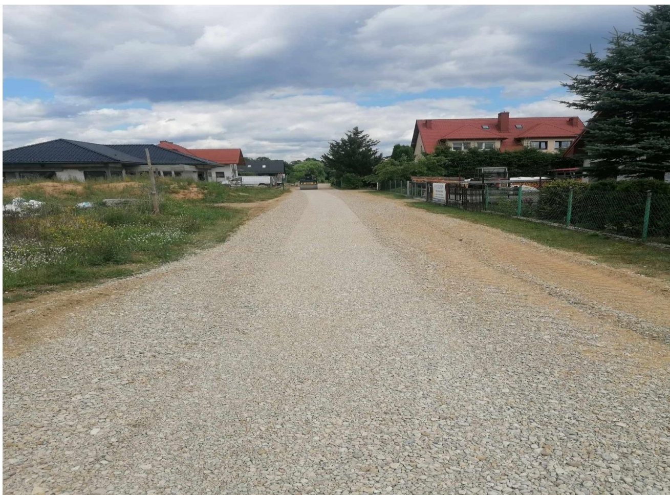
Zdjęcie nr 31 – Wykonanie drogi w miejscowości Nowa Wieś Ełcka, gmina Ełk.

Roboty remontowo-sprzętowe w ramach bieżącego utrzymania i remontów dróg gminnych oraz realizacji Funduszu Sołeckiego w 2023 r. mają za zadanie polepszyć stan dróg gminnych. Łączna długość dróg , którymi zarządza Gmina Ełk to około 910 km. Zewidencjonowanych dróg jest 425,388 km, z których 172,461 km stanowią drogi publiczne, a 252,927 km są to drogi wewnętrzne. W ramach umowy na bieżące utrzymanie i remonty dróg gminnych oraz realizacji Funduszu Sołeckiego pracownicy ZUG poszerzyli, wyrównali oraz utwardzili kruszywem tereny dróg m.in. w Nowej Wsi Ełckiej, Mączach, Buczkach, Piaskach, Cierniach, Oraczach, Chojniaku.