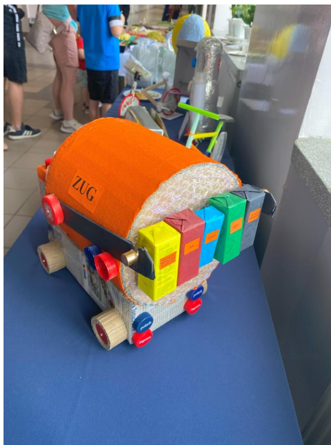
Zdjęcie nr 50 – Samochód ciężarowy typu śmieciarka przygotowany na konkurs „Eko-sztuka” przez jednego z uczestników.

Uczniowie byli bardzo zaangażowani i zainteresowani przebiegiem festynu, chętnie brali udział w zabawach. Wszystko to razem stworzyło wspaniałą atmosferę sprzyjającą integracji społeczności i edukacji w duchu ekologicznym.