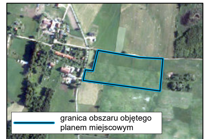
Lokalizacja obszaru objętego planem miejscowym na podkładzie ortofotomapy