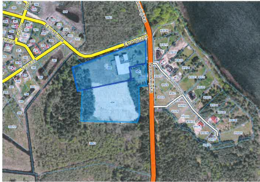
Lokalizacja terenu objętego uchwałą

Teren objęty uchwałą położony jest poza zasięgiem obszarów zalewowych.