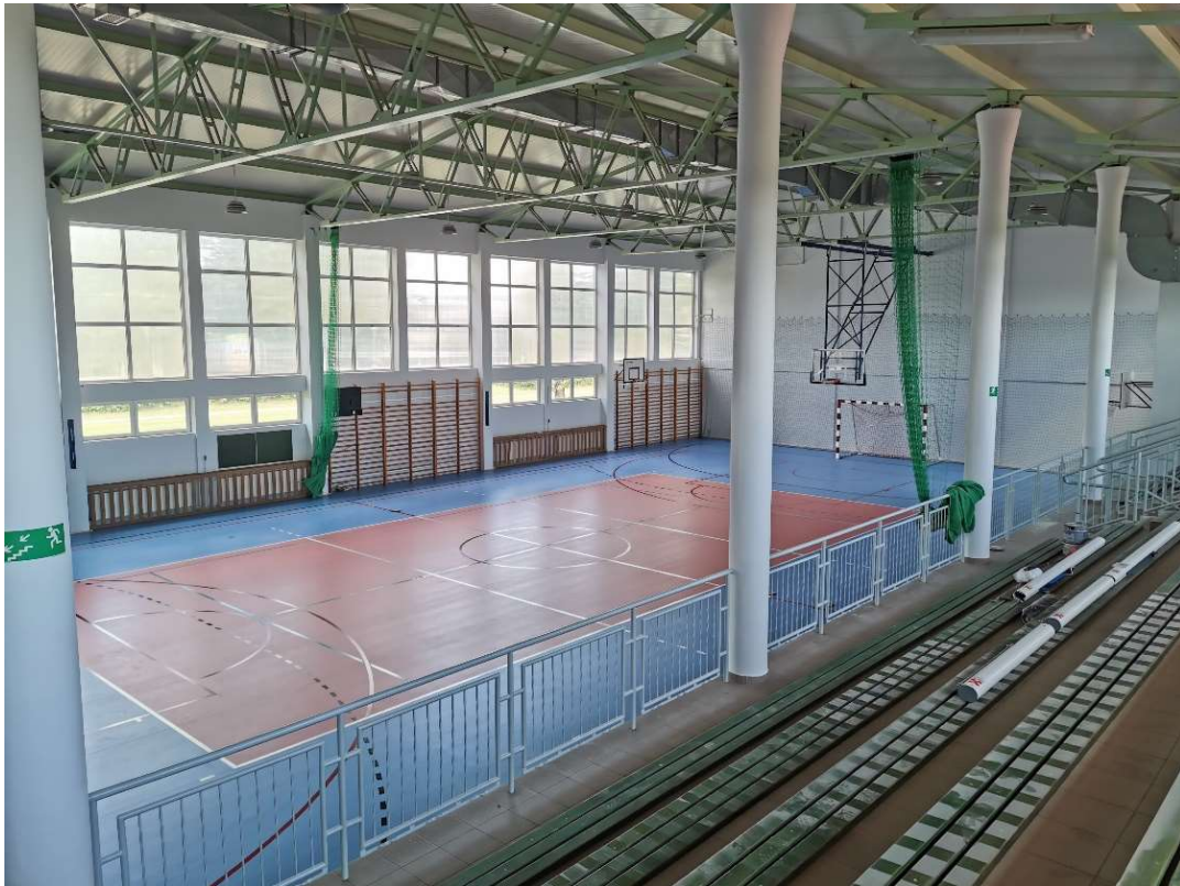
Remont hali sportowej w Zespole Szkolno- Przedszkolnym w Nowej Wsie Etckiej