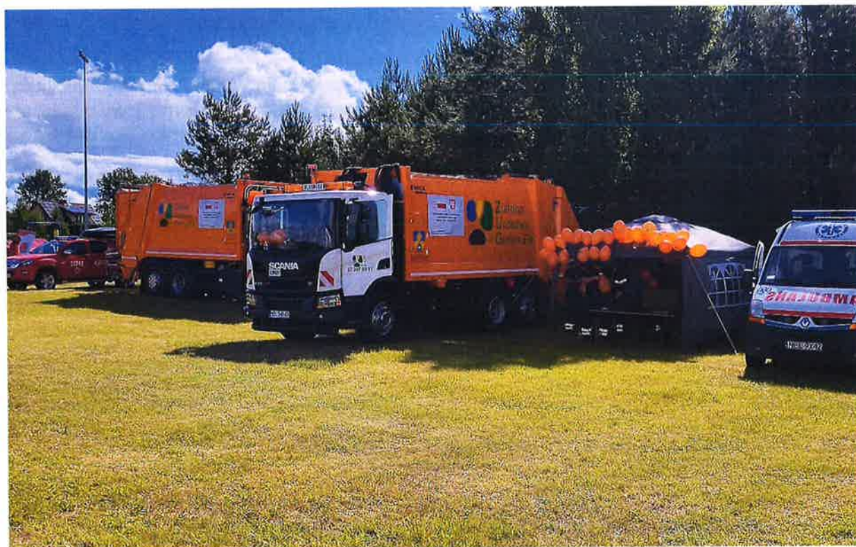
Zdjęcie nr 5 – Stanowisko ZUG w trakcie festynu

Uczniowie byli bardzo zaangażowani i zainteresowani przebiegiem festynu, chętnie brali udział w zabawach. Na stoisku ZUG dowiedzieli się m.in. jak prawidłowo segregować odpady, zmniejszyć zużycie wody i prądu podczas codziennych czynności domowych, jak kompostowanie odpadów organicznych ogranicza ilość śmieci na wysypisku i zmniejsza emisję gazów cieplarnianych.