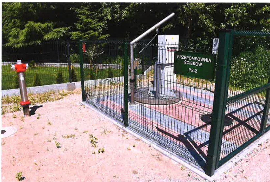
Zdjęcie nr 3 – Inwestycja budowy sieci wod.-kan. w miejscowościach Barany - Chruściele