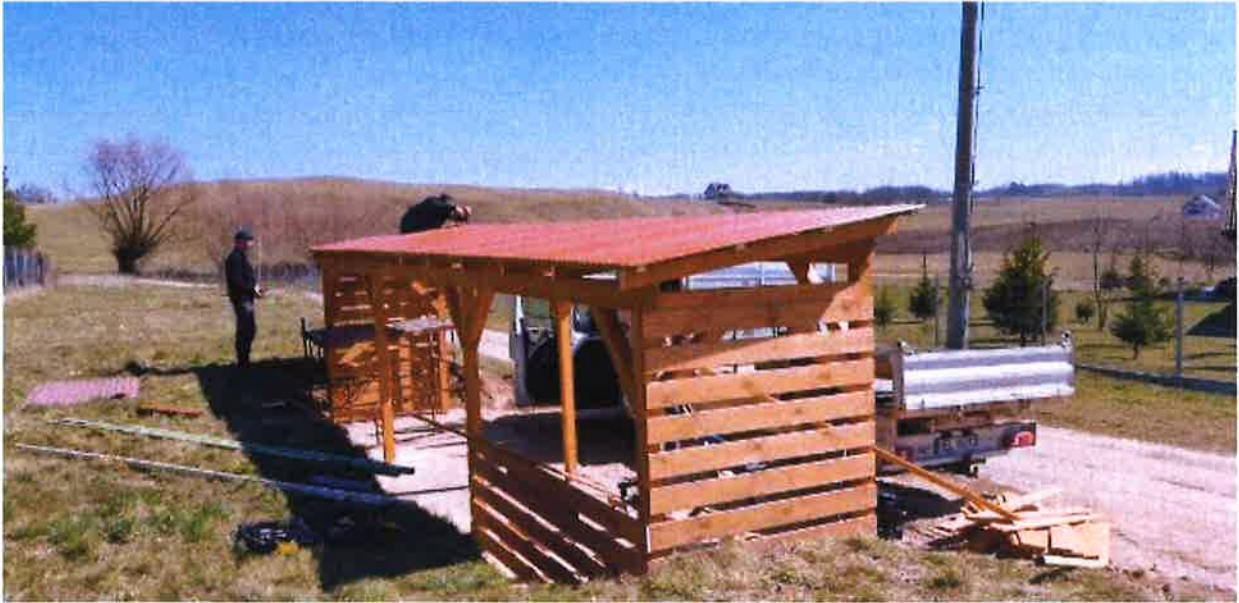
Zdjęcie nr 4 – Obudowa gniazda na odpady w sołectwie Piaski, Źródło: Archiwum własne

ZUG dokłada wszelkich starań, aby odpady z działek letniskowych tzw. gniazda były utrzymane w czystości oraz porządku w miejscu gromadzenia odpadów.