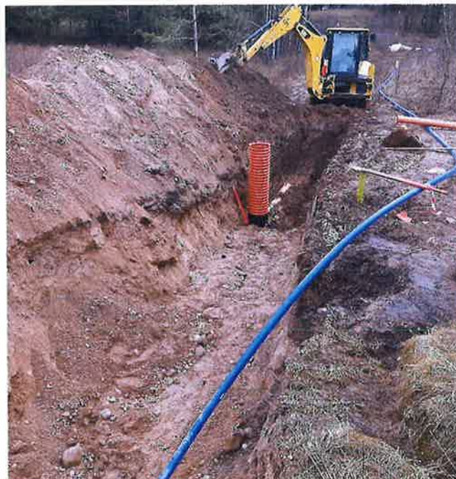
Zdjęcie nr 22– Budowa sieć wodno-kanalizacyjnej w miejscowości Piaski dz. 83/11

W ramach zadania wybudowana została sieć wodociągowa o długości około 305 m i sieć kanalizacji sanitarnej o długości około 290 m. Budowa sieci wodno-kanalizacyjnej wykonywana na zlecenie prywatnych inwestorów zostanie przekazana na stan ZUG na mocy zawartego porozumienia na przekazanie sieci wodno-kanalizacyjnej.