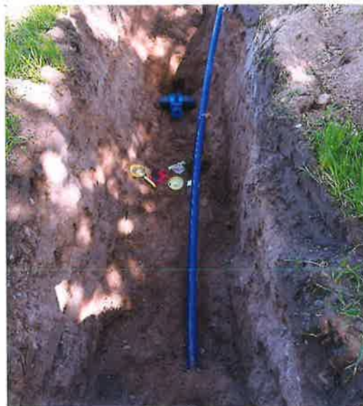
Zdjęcie nr 26– Budowa sieci wodno-kanalizacyjnej w miejscowości Bartosze dz. 54/21, 47/1, 352

W ramach zadania wybudowana została sieć wodociągowa o długości około 110 m. Budowa sieci wodno-kanalizacyjnej wykonywana na zlecenie prywatnych inwestorów zostanie przekazana na stan ZUG na mocy zawartego porozumienia na przekazanie sieci wodno-kanalizacyjnej.