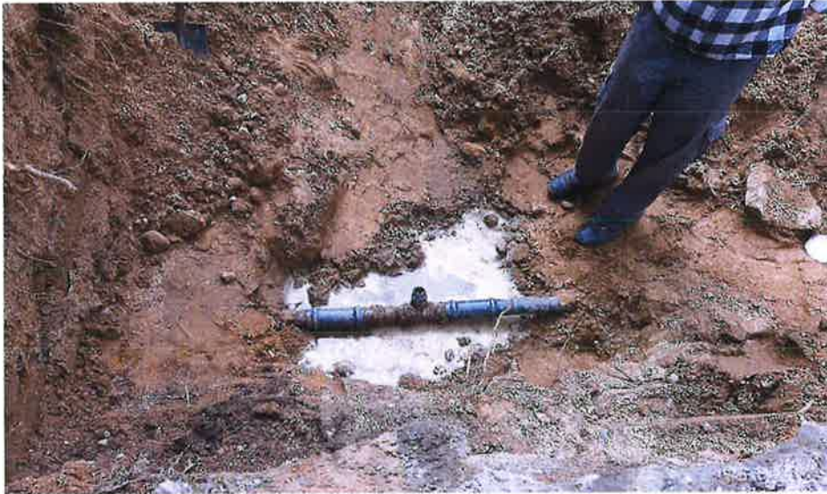
Zdjęcie nr 21– Awaria na sieci wodociągowej na ul. Małeckich w miejscowości Nowa Wieś Etcka