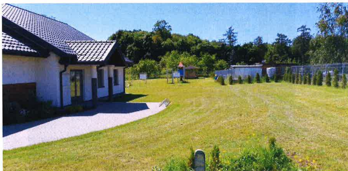
Zdjęcie nr 11 – Teren świetlicy w Ruskiej Wsi (Archiwum ZUG)