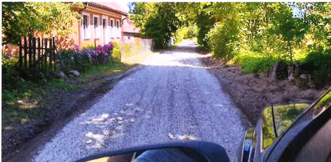
Zdjęcie nr 12 – Droga w miejscowości Zdedy

Poprawa infrastruktury drogowej na terenie gminy to jedno z priorytetowych zadań realizowanych przez władze Gminy Ełk we współpracy z Zakładem Usług Gminnych Gmina Ełk. W ramach umowy na bieżące utrzymanie i remontów dróg gminnych oraz realizacji Funduszu Sołeckiego pracownicy ZUG poszerzyli, wyrównali oraz utwardzili kruszywem tereny dróg w poszczególnych miejscowościach, tak aby był lepszy dojazd mieszkańcom gminy. Drogi zostały wykonane m.in.: