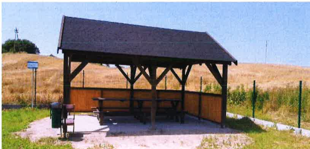
Zdjęcie nr 6 – Wiata w Nowej Wsi Ełckiej Szosa Bajtkowska

Na terenie gminy Ełk powstały nowe wiaty rekreacyjne, które służą jako miejsca spotkań, zebrań i integracji mieszkańców danej wsi. Takie wiaty powstały m.in. w miejscowości Nowa Wieś Ełcka – Szosa Bajtkowska i Sordachy. Wiata w Nowej Wsi Ełckiej – Szosa Bajtkowska powstała dzięki dotacji z budżetu Powiatu Ełckiego oraz w ramach realizacji funduszu sołeckiego.