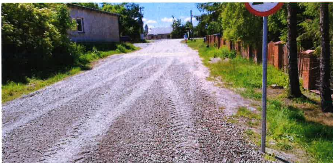
Zdjęcie nr 14 – Utwardzenie drogi w miejscowości Konieczki