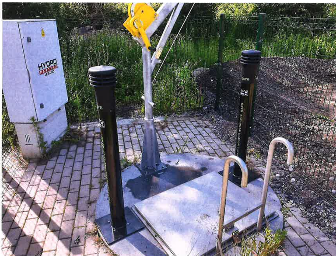
Zdjęcie nr 15 – Montaż filtrów antyodorowych na przepompowni ścieków w miejscowości Sędki.