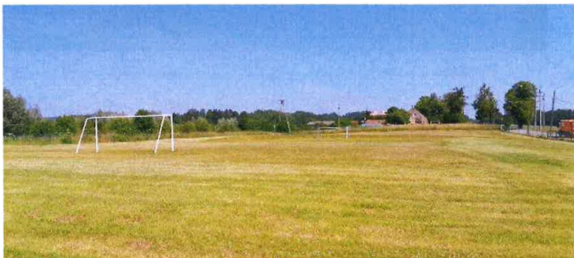
Zdjęcie nr 7 – Boisko w Siedliskach