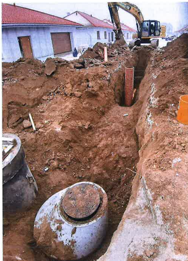
Zdjęcie nr 1 – Inwestycja budowy sieci wod.-kan. w miejscowościach Barany - Chruściele