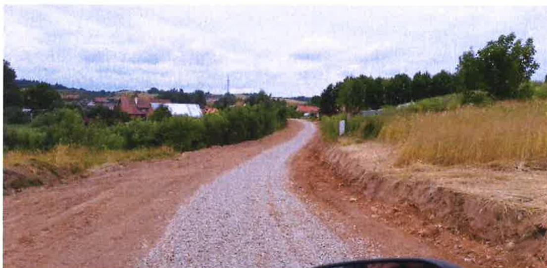
Zdjęcie nr 18 – Wykonanie drogi w Oraczach