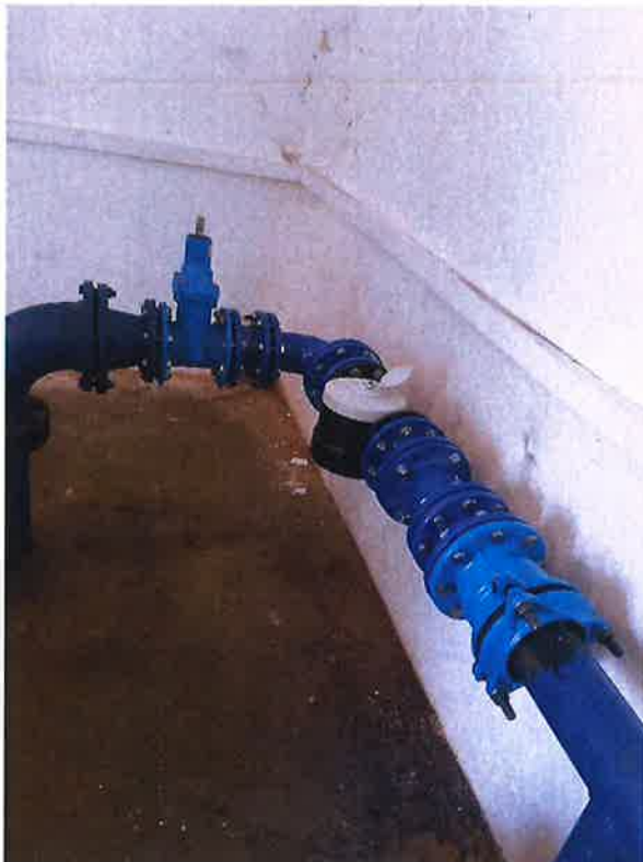
Zdjęcie nr 11 – Montaż urządzenia pomiarowego w Stacji podnoszenia ciśnienia w Nowej Wsi Etckiej