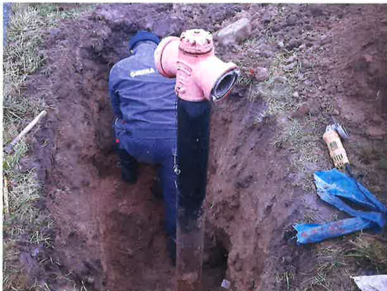
Zdjęcie nr 8 – Wymiana hydrantu p.poz w miejscowości Regiel