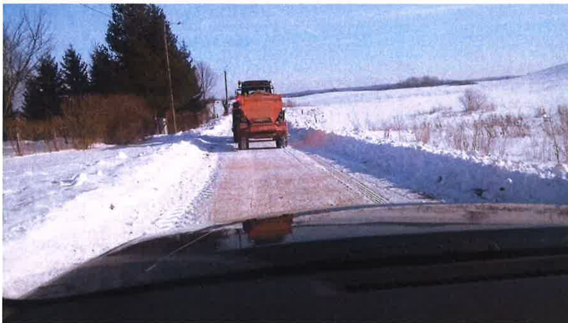
Zdjęcie nr 1 – Odśnieżanie i posypywanie dróg na terenie gminy Ełk

Spółka dysponuje specjalistycznym sprzętem do posypywania i odśnieżania dróg tj. ciągniki z posypywarką i pługiem odśnieżnym, samochodem ciężarowym z posypywarką i pługiem odśnieżnym.