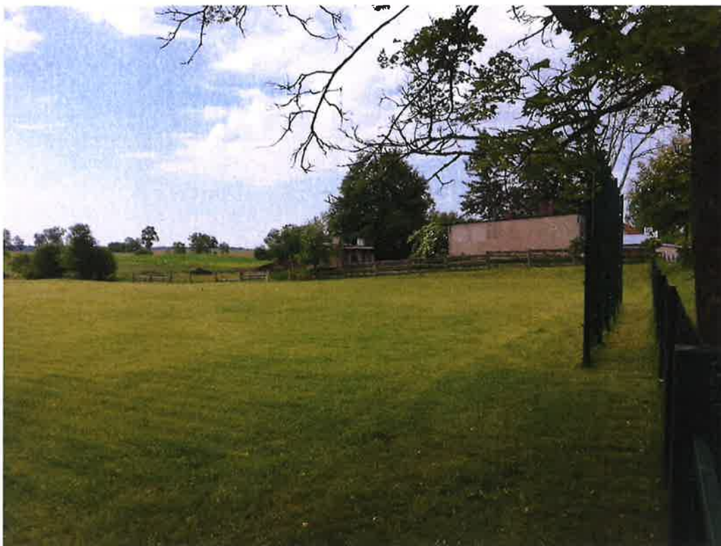
Zdjęcie nr 8 – Boisko w Kałużynach