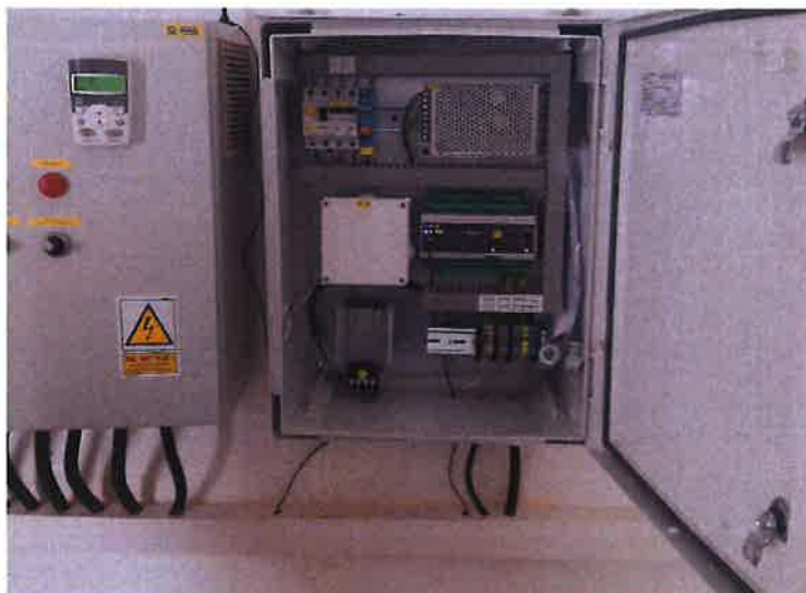
Zdjęcie nr 12 – Zamontowane urządzenia pomiarowe do zdalnego odczytu w miejscowości Nowa Wieś Etcka