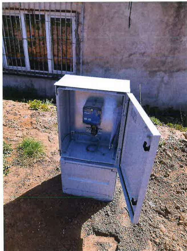
Zdjęcie nr 14 – Zamontowane urządzenia pomiarowe do zdalnego odczytu w miejscowości Chojniak.