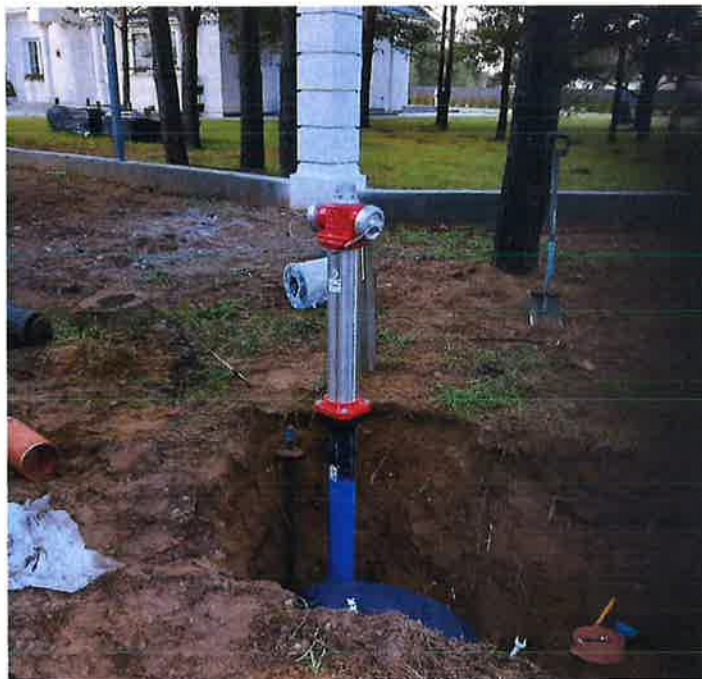
Zdjęcie nr 9 – Wymiana hydrantu p.poż w miejscowości Barany ul. Żabie Oczko