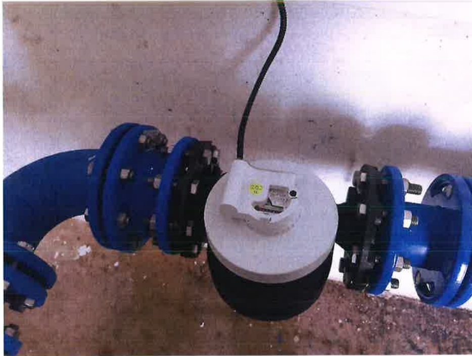
Zdjęcie nr 13 – Zamontowane urządzenia pomiarowe do zdalnego odczytu w miejscowości Nowa Wieś Etcka