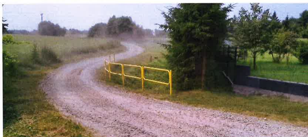
Zdjęcie nr 16 – Skarpowanie i utwardzenie drogi w Szarejkach