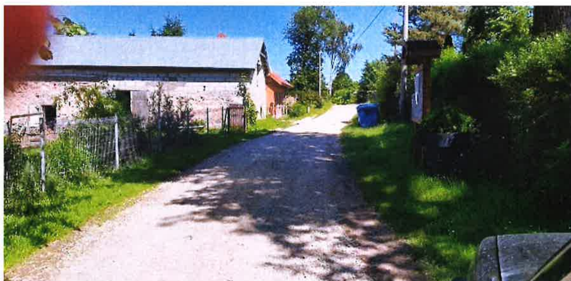
Zdjęcie nr 13 – Droga w miejscowości Zdedy