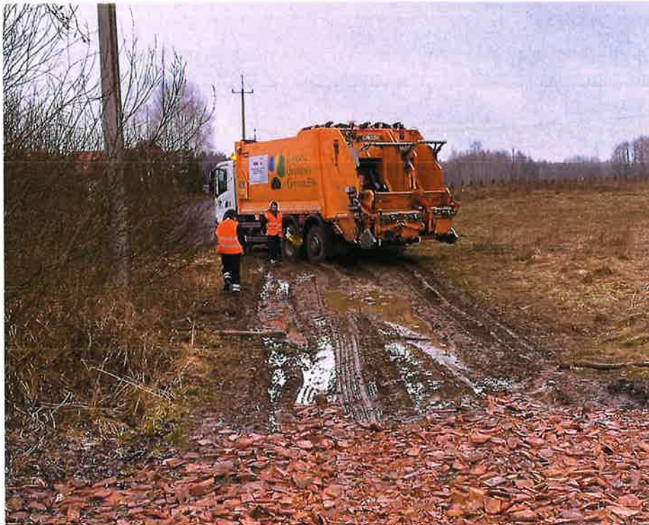
Zdjęcie nr 2 – Problemy z dojazdem