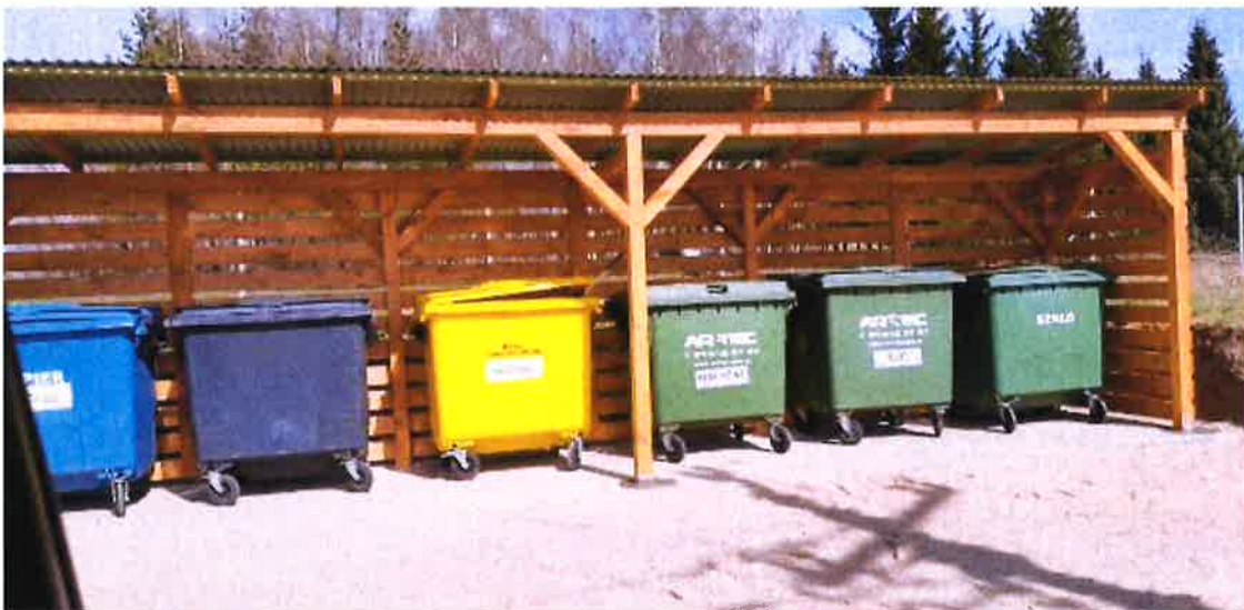
Zdjęcie nr 5 – Obudowa gniazda na odpady w sołectwie Piaski