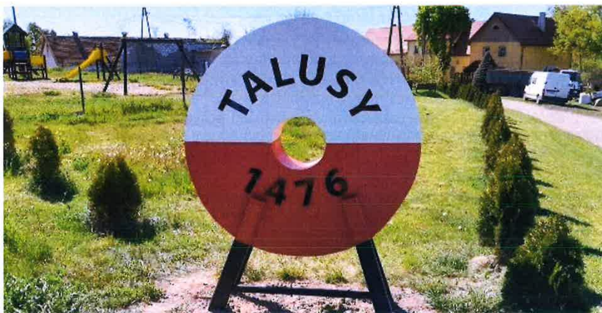
Zdjęcie nr 2 – Koło z napisem miejscowości Talusy