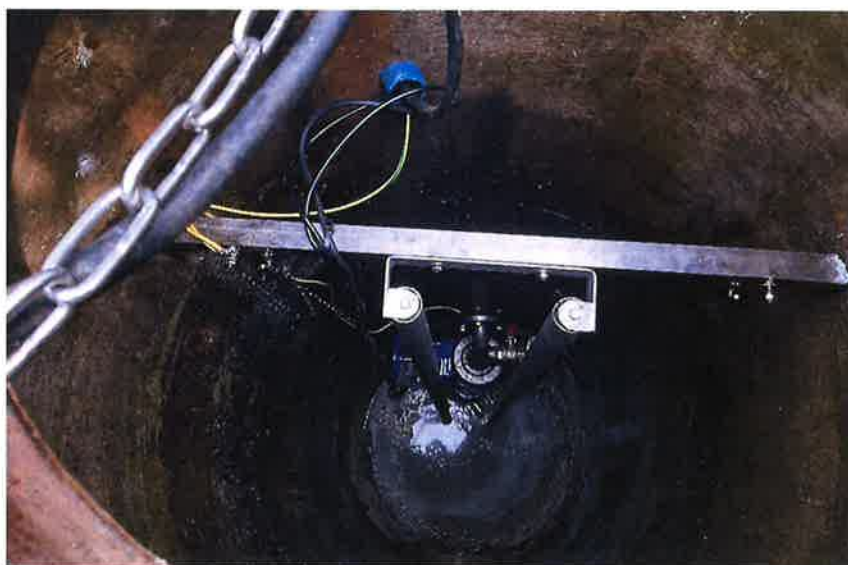
Zdjęcie nr 16 – Modernizacja przepompowni ścieków w miejscowości Lega