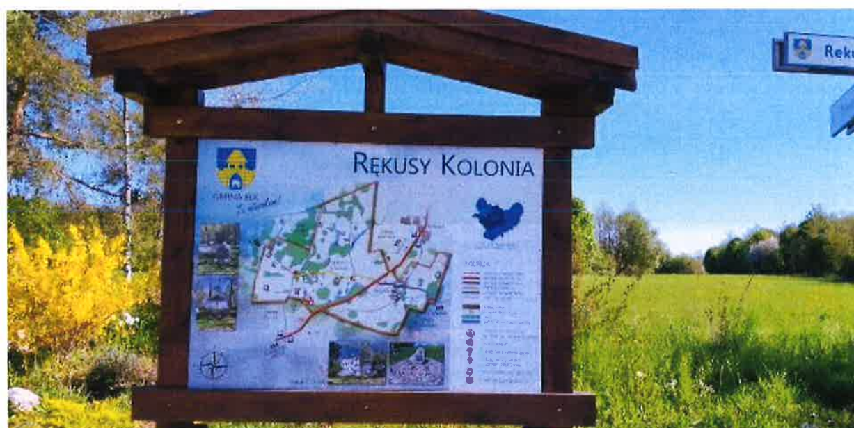
Zdjęcie nr 3 – Tablica z mapą miejscowości w sołectwie Rękusy