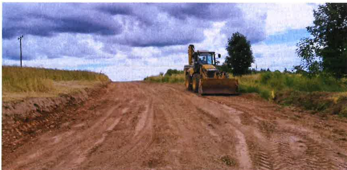
Zdjęcie nr 17 – Wykonanie drogi w Oraczach