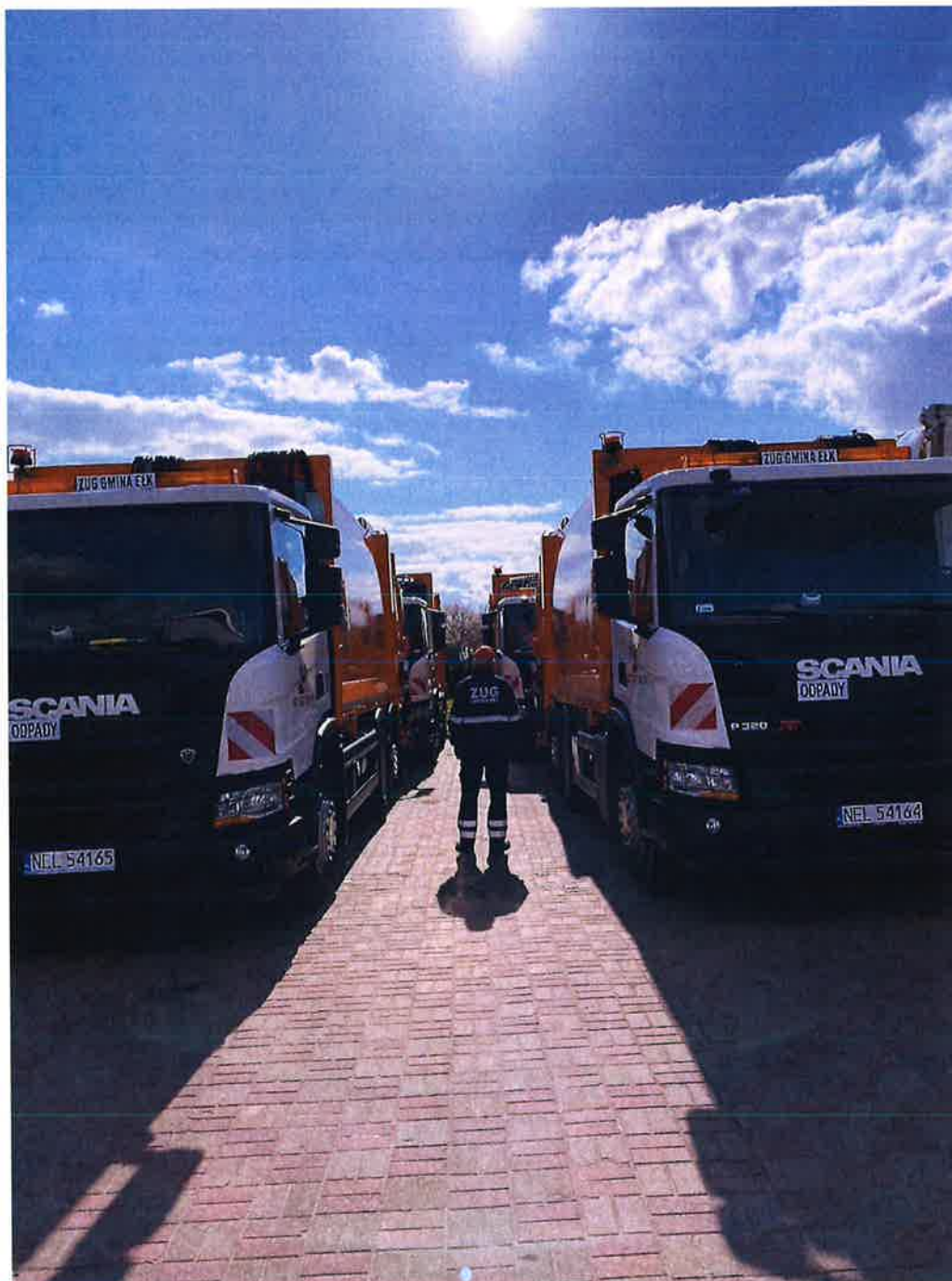
Zdjęcie nr 1 – Samochody ciężarowe typu śmieciarka

Zakład Usług Gminnych Gmina Ełk Sp. z o.o. w 2022 roku rozpoczął świadczenie usługi pn.: „Odbiór i transport odpadów komunalnych z terenu gminy Ełk” w ramach umowy nr 110/2021 z 30 grudnia 2021 r oku podpisanej z Gminą Ełk. Realizacja przedmiotu umowy jest możliwa dzięki przekazaniu w dzierżawę czterech nowych ciężarówek typu śmieciarka Spółce przez Gminę Ełk, na mocy umowy nr 1/XII/2021 z 09 grudnia 2021 roku