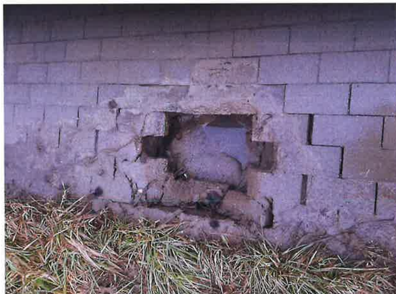
Zdjęcie nr 18 – Awaria kolektora kanalizacji ciśnieniowej w miejscowości Chruściele.