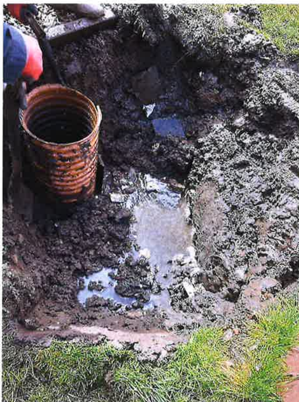
Zdjęcie nr 19 – Awaria kolektora kanalizacji grawitacyjnej w miejscowości Sędki