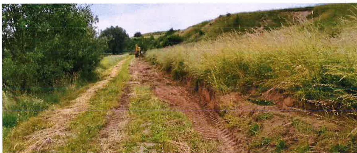
Zdjęcie nr 15 – Skarpowanie i utwardzenie drogi w Szarejkach