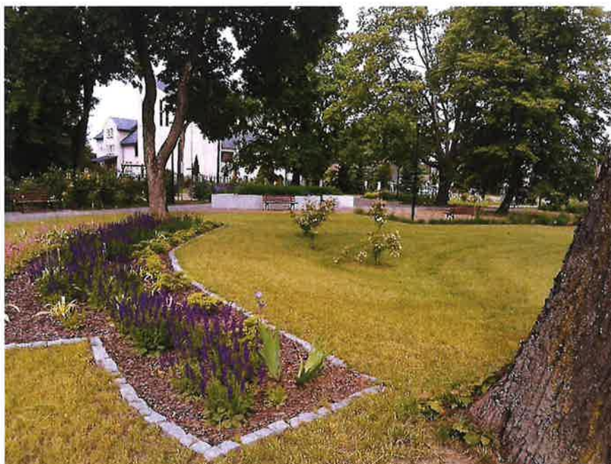
Zdjęcie nr 9 – Park w Nowej Wsi Elckiej