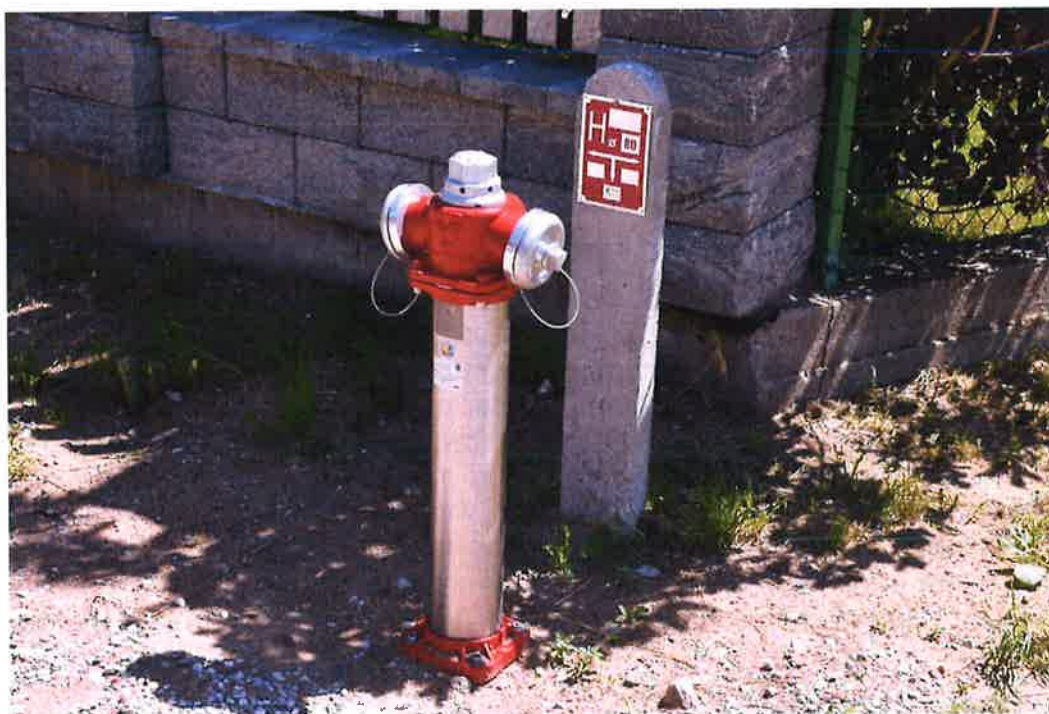
Zdjęcie nr 2 – Inwestycja budowy sieci wod.-kan. w miejscowościach Barany - Chruściele