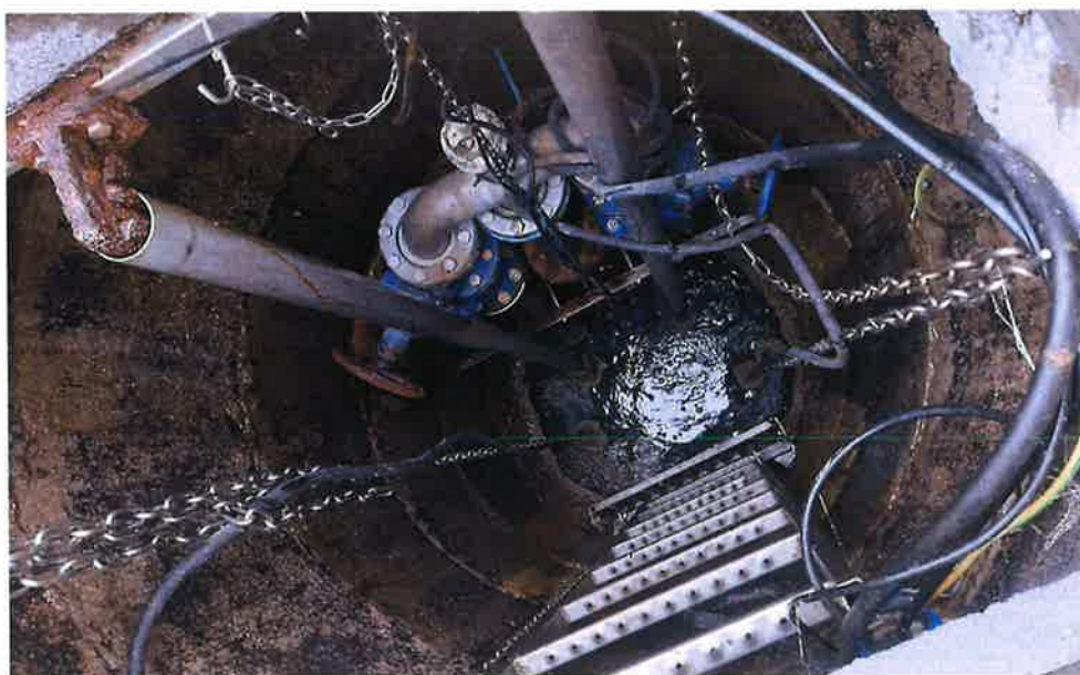
Zdjęcie nr 10 – Wymiana układu technologicznego w przepompowni ścieków w Malinówce