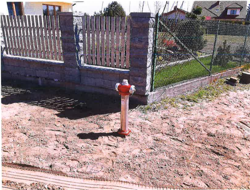
Zdjęcie nr 6 – Inwestycja budowy sieci wod.-kan. w miejscowościach Barany - Chruściele