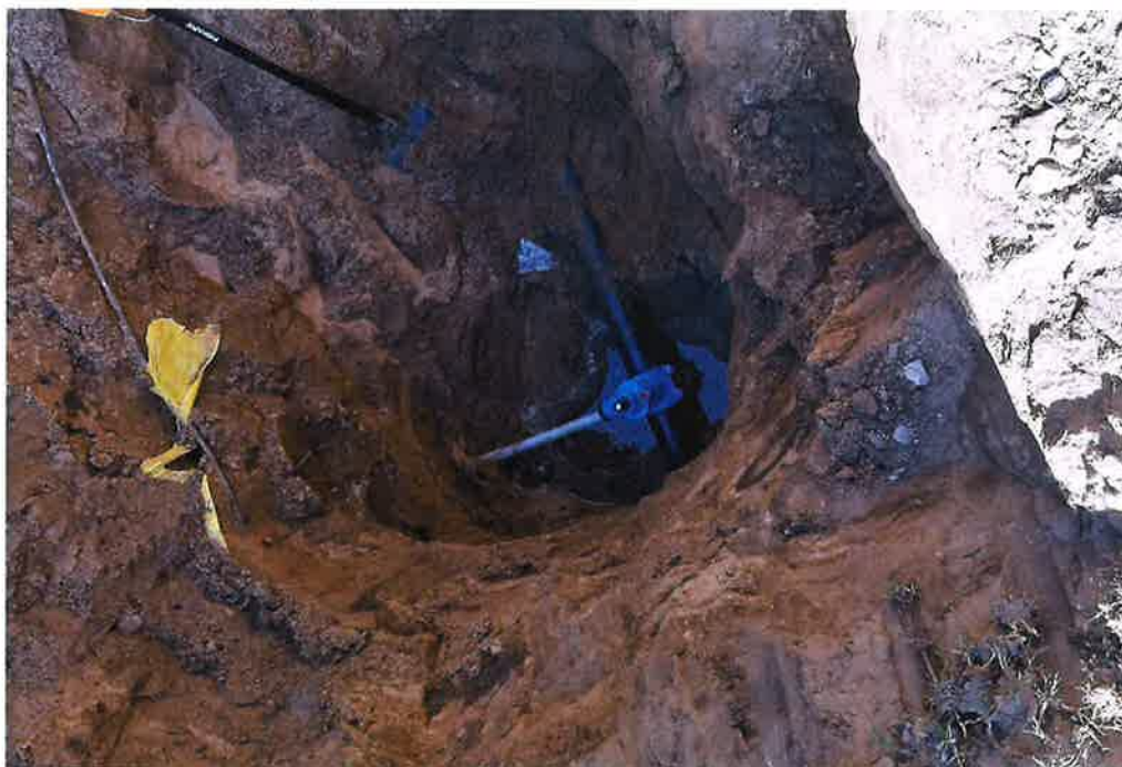
Zdjęcie nr 20 – Awaria na sieci wodociągowej na ul. Szkolnej w miejscowości Straduny.