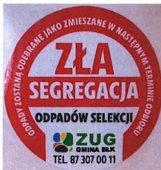
Zdjęcie nr 4 – Naklejka z informacją o złej segregacji

Od stycznia 2021 roku na terenie gminy Elk zaczęły obowiązywać nowe zasady selektywnej zbiórki odpadów. Mieszkańcy powinni segregować śmieci na pięć frakcji: papier, szkło, metale i tworzywa sztuczne, odpady biodegradowalne oraz odpady resztkowe. W związku z powyższym ZUG egzekwuje od mieszkańców prawidłową segregację. Pracownicy przy odbiorze kontrolują, czy odbierana frakcja jest poprawnie sortowana.