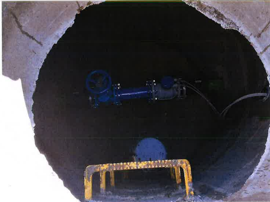
Zdjęcie nr 5 – Inwestycja budowy sieci wod.-kan. w miejscowościach Barany - Chruściele