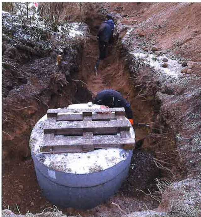
Zdjęcie nr 23– Budowa sieć wodno-kanalizacyjnej w miejscowości Piaski dz. 83/11