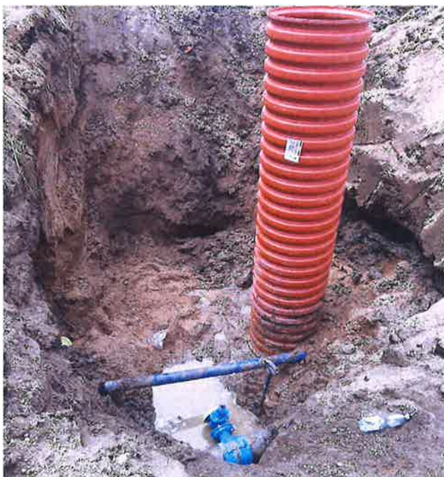
Zdjęcie nr 24– Budowa sieci wodno-kanalizacyjnej w miejscowości Bartosze dz. 53/12

W ramach zadania wybudowana została sieć wodociągowa o długości około 120 m i sieć kanalizacji sanitarnej o długości około 104 m. Budowa sieci wodno-kanalizacyjnej wykonywana na zlecenie prywatnych inwestorów zostanie przekazana na stan ZUG na mocy zawartego porozumienia na przekazanie sieci wodno-kanalizacyjnej.