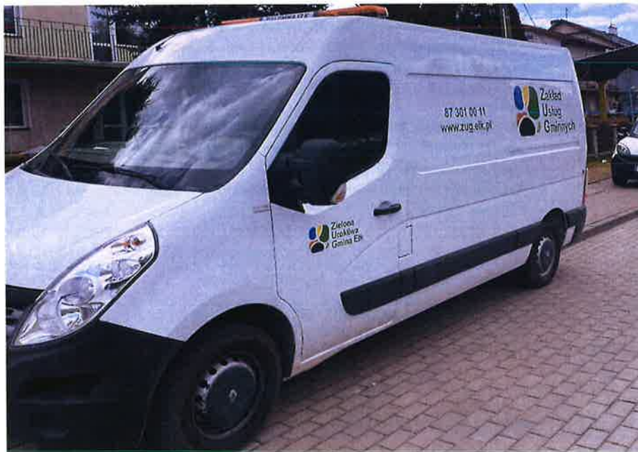
Zdjęcie nr 3 – Nowy samochód Renault Master