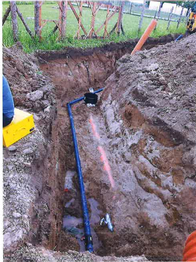
Zdjęcie nr 25– Budowa sieci wodno-kanalizacyjnej w miejscowości Bartosze dz. 53/12