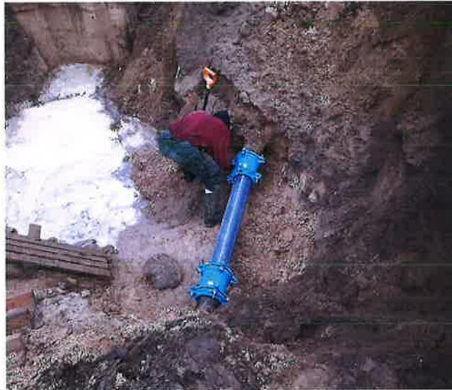
Zdjęcie nr 17 – Awaria przy przebudowie wodociągu przy budynku Arhelan (Archiwum ZUG)

Przebudowa sieci wodociągowej wykonywana była pod nadzorem Zakładu Usług Gminnych Gmina Ełk Sp. z o.o. Inwestor wykonał na własny koszt hydrant przeciwpożarowy w ramach przebudowy sieci wodociągowej.