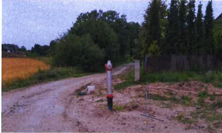
Zdjęcie nr 7 – Inwestycja budowy sieci wod.-kan. w miejscowości Bartosze dz. 69

Budowa sieci wodno-kanalizacyjnej zrealizowana została wraz z prywatnym inwestorem, a w ramach tej inwestycji wybudowano około 185 m sieci wodociągowej i około 182 m sieci kanalizacyjnej. Zamontowano także jeden hydrant przeciwpożarowy.