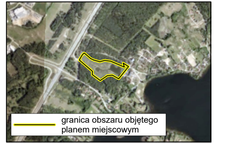
Lokalizacja obszaru objętego planem miejscowym na podkładzie ortofotomapy